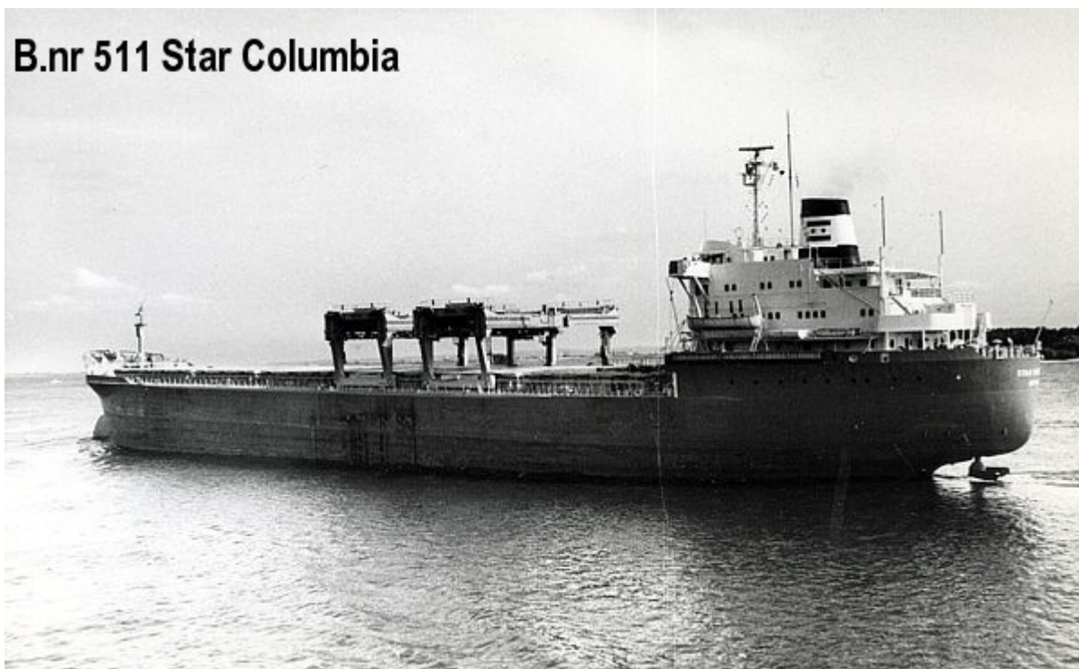
B.nr 511 Star Columbia

En bild till, från bildarkivet Kockums Mekaniska Verkstads AB: