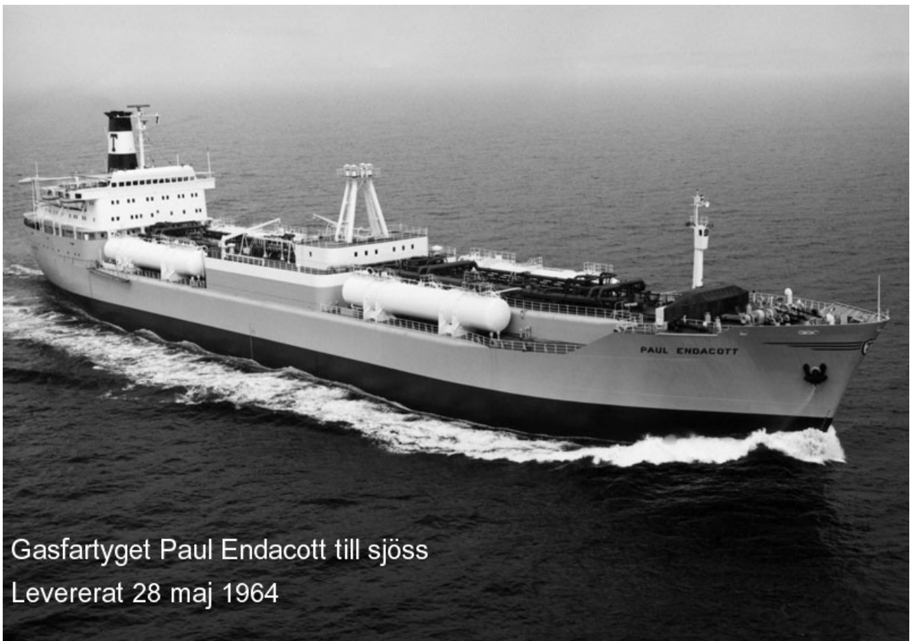
Gasfartyget Paul Endacott till sjöss Levererat 28 maj 1964