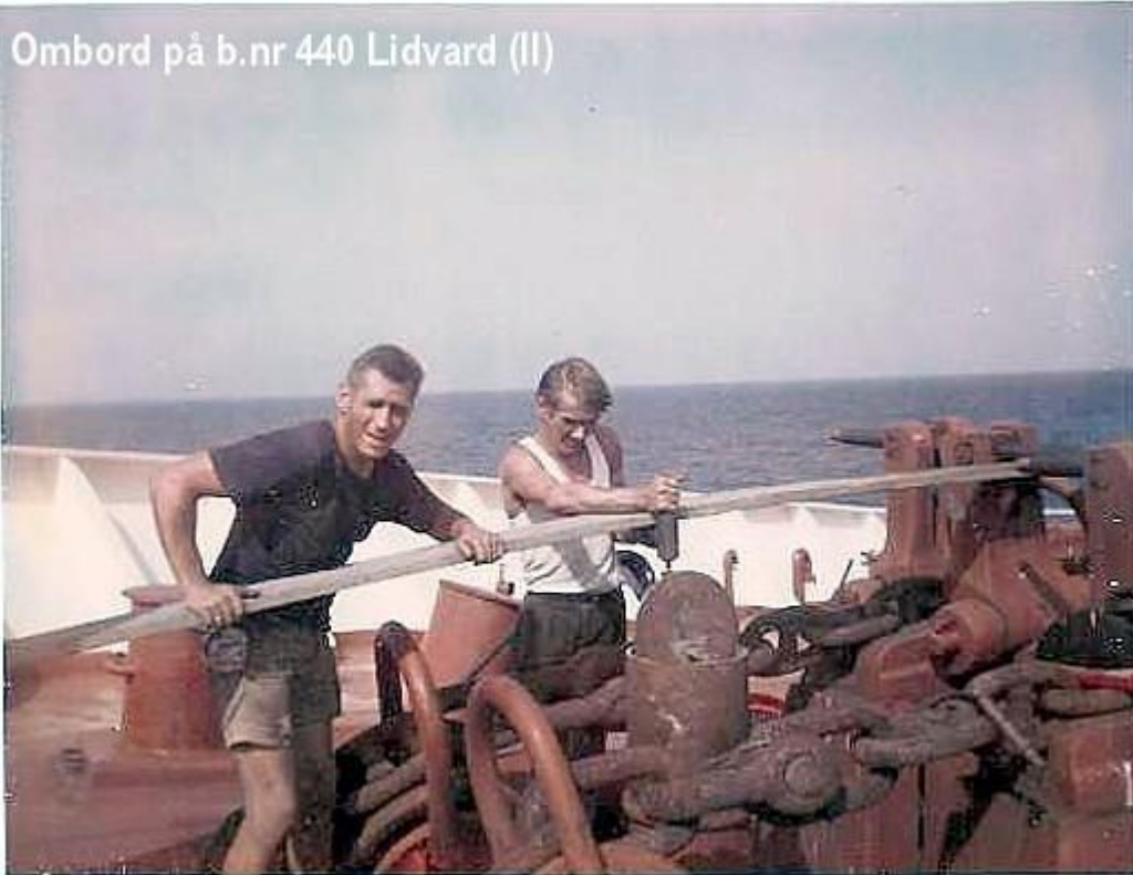
Ombord på b.nr 440 Lidvard (II)