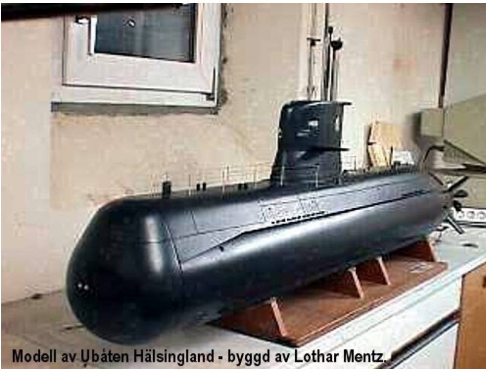
Modell av Ubåten Hälsingland - byggd av Lothar Mentz.

Modell av ubåten Hälsingland – byggd av Lothar Mentz.