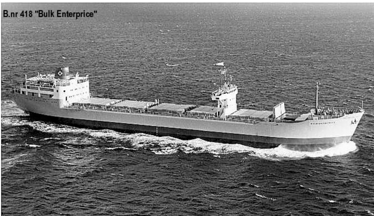
B.nr 418 "Bulk Enterprice"