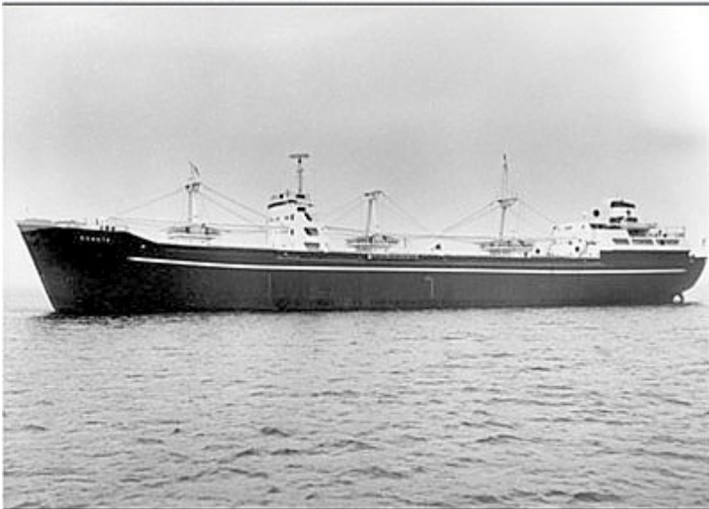
B.nr 413 Sonata - levererat 26 mars 1956