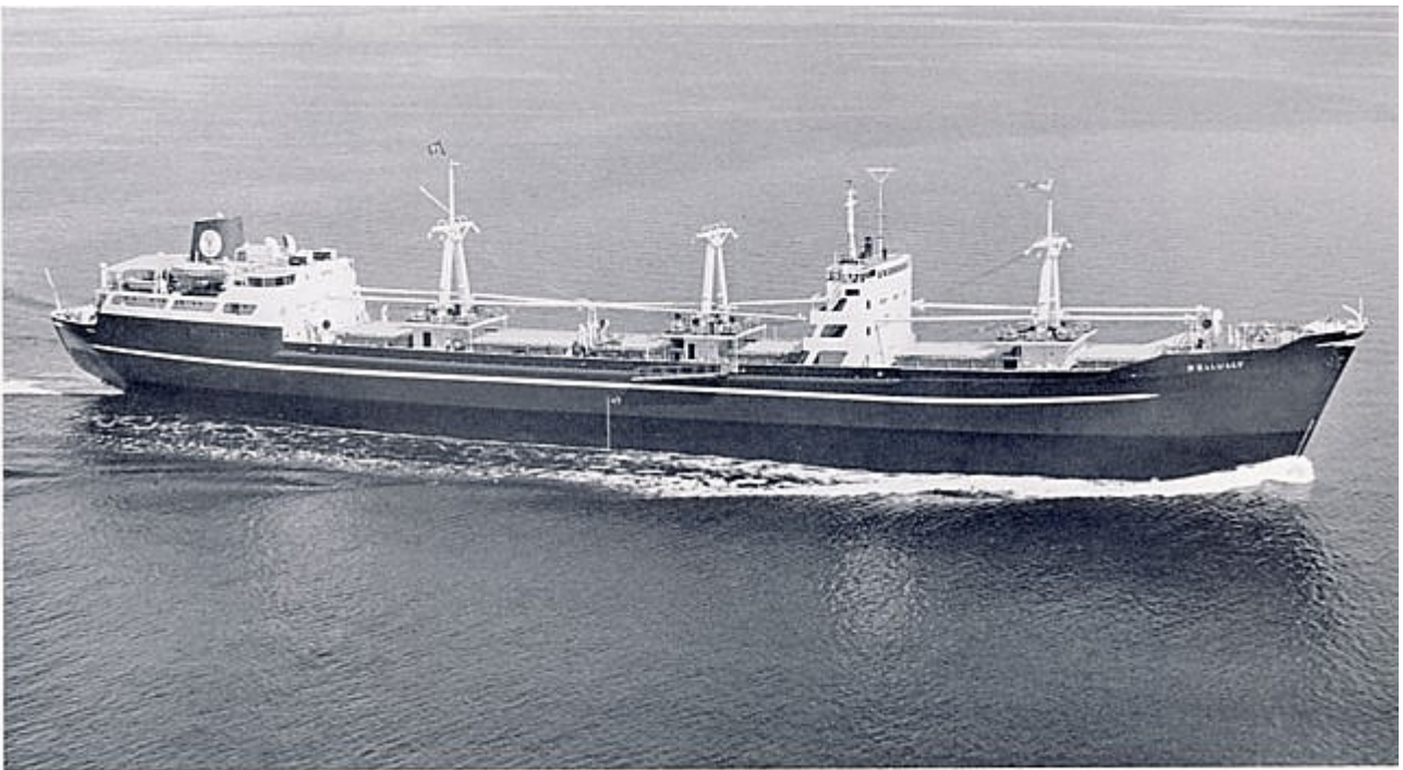
M.S. BELLULLY, cargo motorship 13,400 tons d.w., 14½ knots.