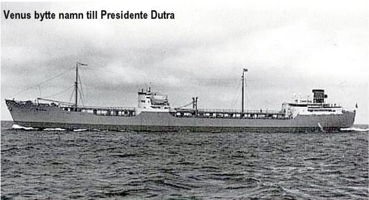
Venus bytte namn till Presidente Dutra