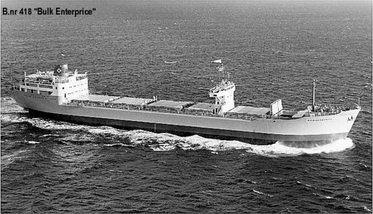
B.nr 418 "Bulk Enterprice"