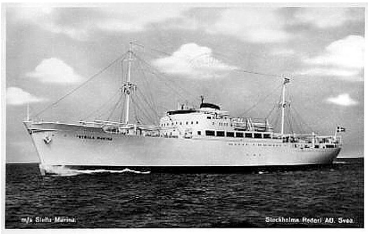
M/S Stella Marina. Stockholms Rederi AB Svea.