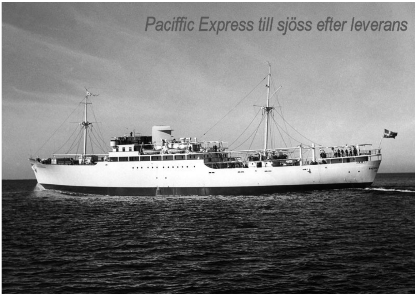
Pacific Express till sjöss efter leverans.