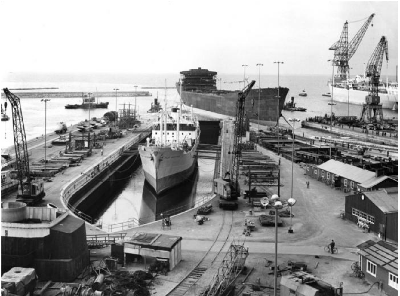
Varvsbild från 1957: Docka 3 med reparenten Tilia Gorthon. Sjösetting av tankfartuget Butmah, Bnr 390.