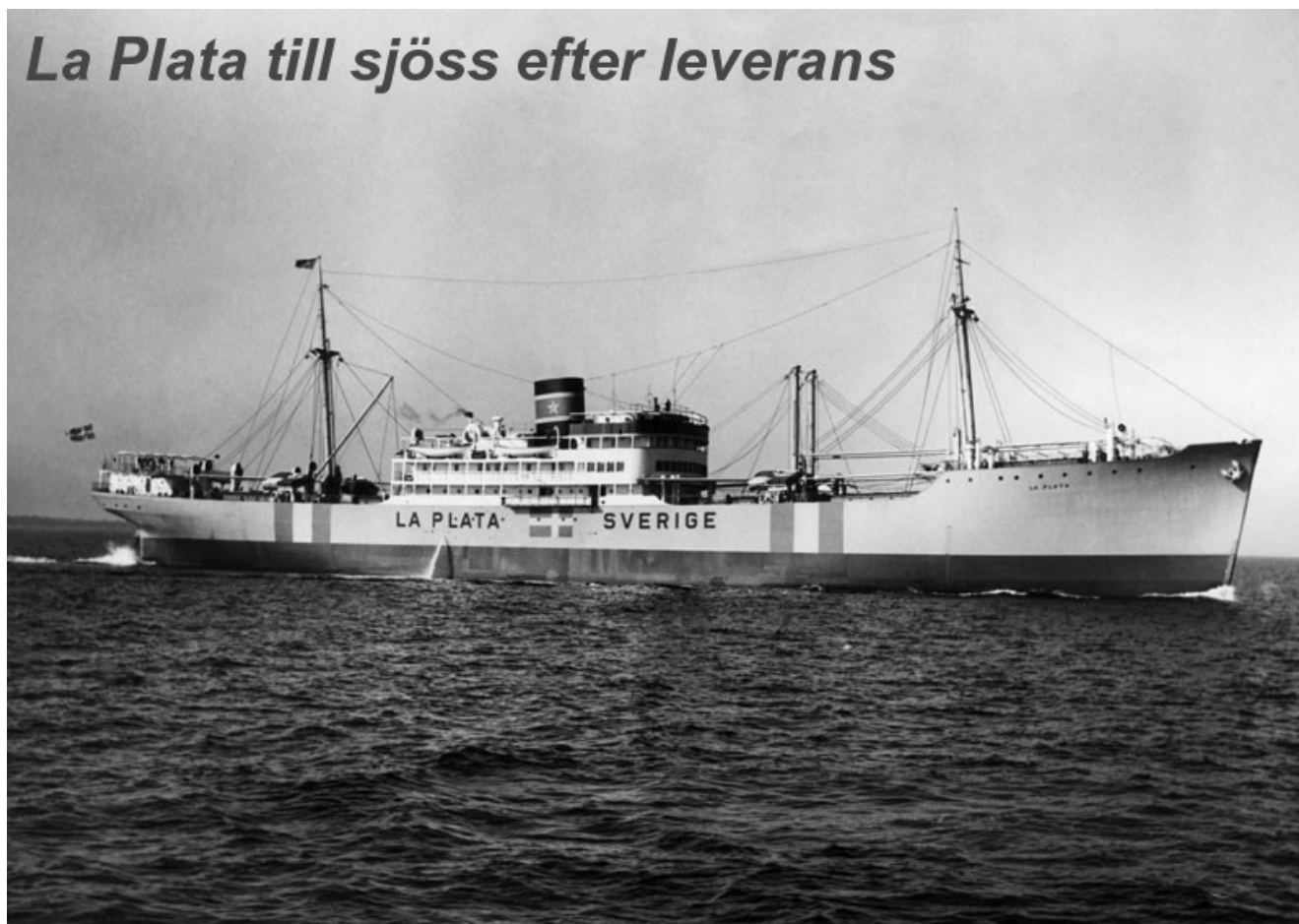
La Plata till sjöss efter leverans.