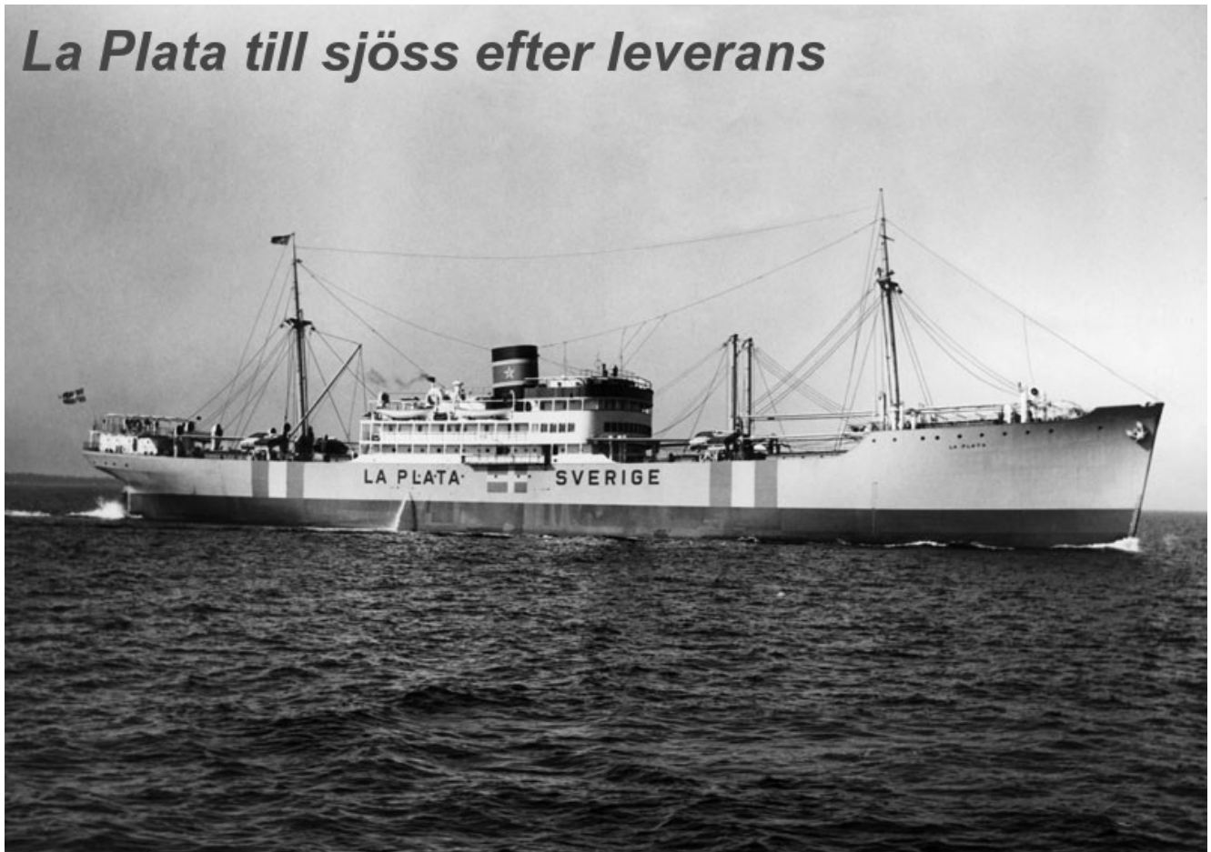
La Plata till sjöss efter leverans.