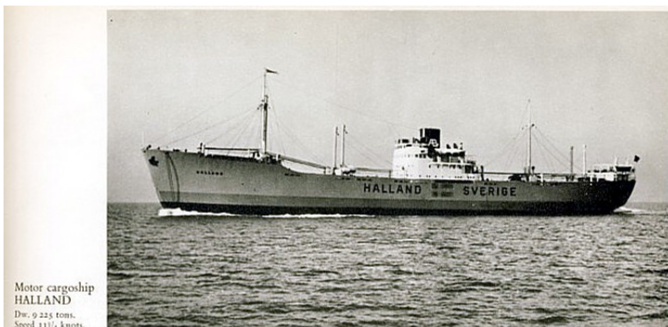
Motor cargoship Halland