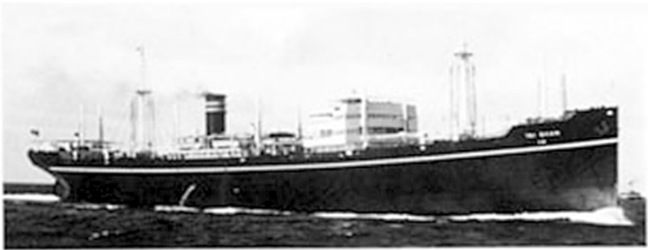
TAI SHAN under the Panamanian flag