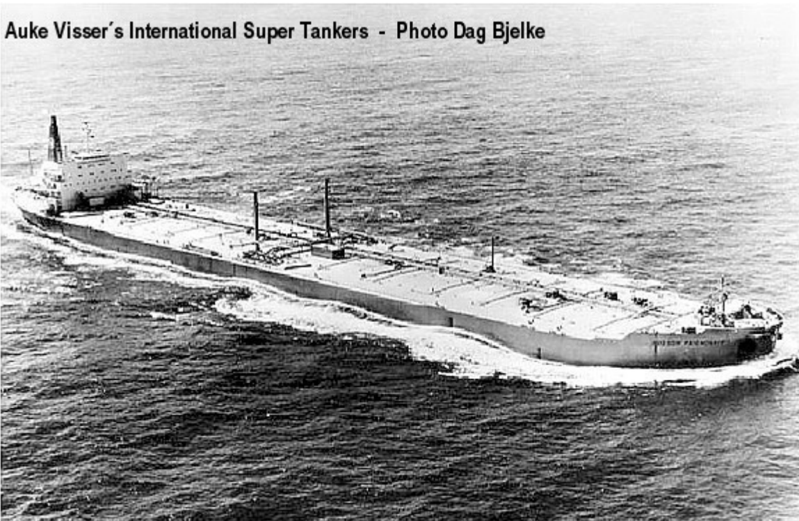
Auke Visser's International Super Tankers - Photo Dag Bjelke

Auke Visser's International Super Tankers – Photo Dag Bjelke.