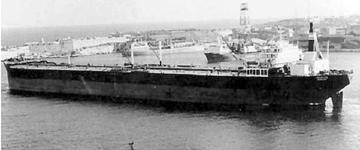
B.nr 526 Hudson Venture (here with new name Gratian ) – photo Dag Bjelke.

Fler bilder, från bildarkivet Kockums Mekaniska Verkstads AB: