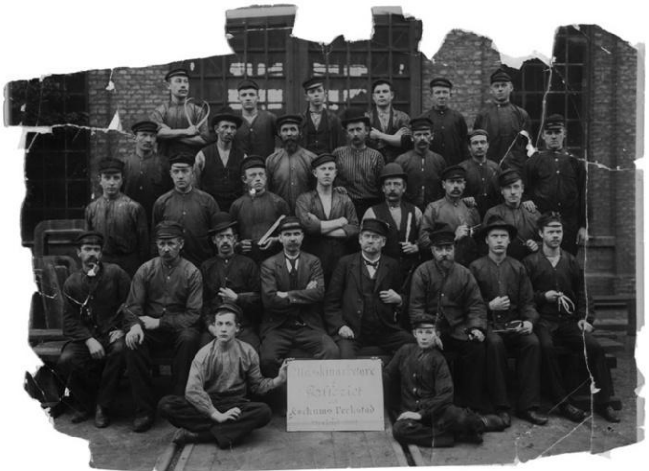
Personalbild 1902: Maskinarbetarna på galleriet.