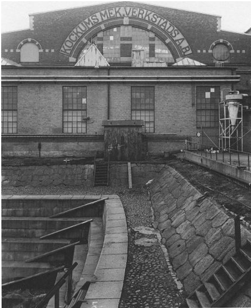
Docka 1 och maskinverkstaden