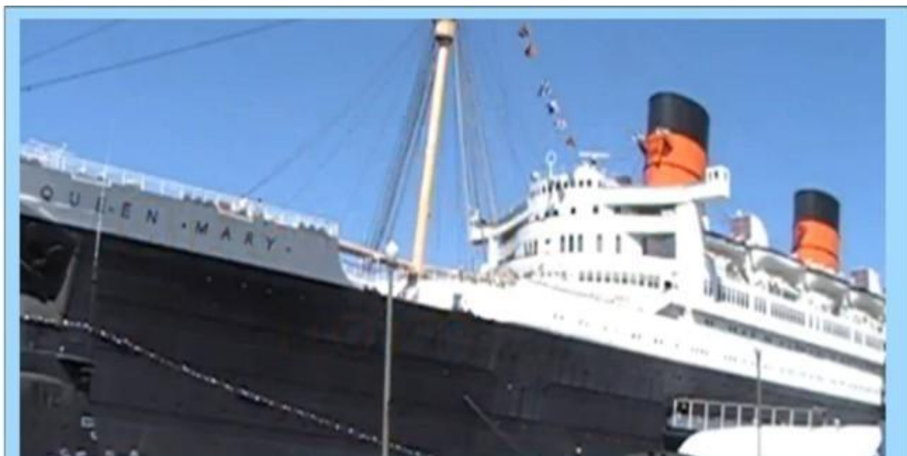
Bild någon gång 1936 - 1967