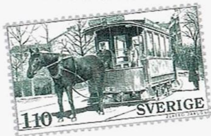
En hästspårvagn från Kockums hamnade på frimärke 1977

Kockums Mekaniska Verkstäder, som grundades 1840 var fram till 1913 förlagda till Kärleksgatan och Davidhallstorg och hade en mycket varierande verkstadsproduktion.