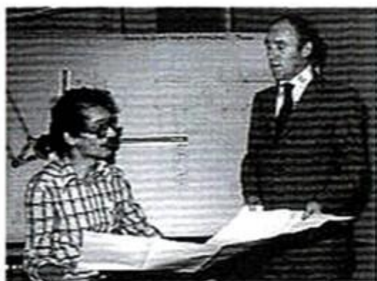
Det fanns många specialister på ritkontoren 1978

Det är många som under årens lopp har jobbat på Kockums och även fått sin utbildning där. Det finns åtskilliga yrkeskategorier representerade i Kockums verkstads- och varvsproduktion.