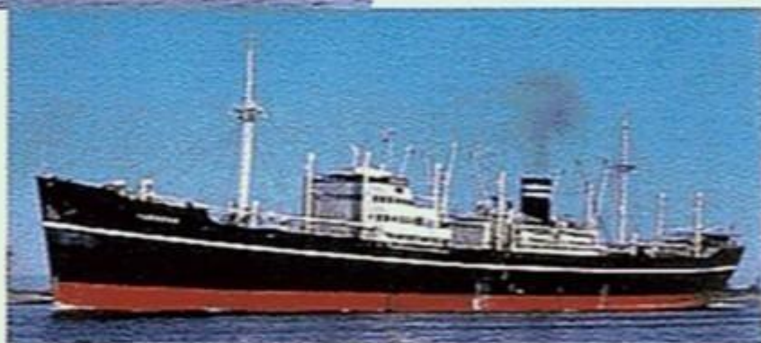
"Torrens" Wilh. Wilhelmsen- rederiet 1939

Kockums var också ett tekniskt ledande varv genom ett omfattande och målmedvetet forsknings- och utvecklingsarbete samt genom en kraftfull satsning på såväl teknisk som administrativ datautveckling.