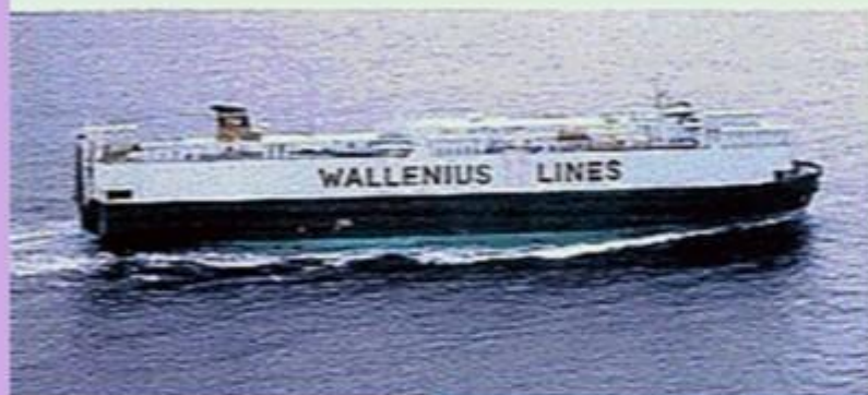
"Figaro" Walleniusrederiet 1981

Redan år 1872 förlades fartygstillverkningen till det nuvarande varvsområdet. Ett område som efterhand utökades genom omfattande utfyllnader i Öresund. Kockums blev ett av världens största och tekniskt mest avancerade varv redan i början av 1950-talet. Sammanlagt byggde Kockums över 600 fartyg.