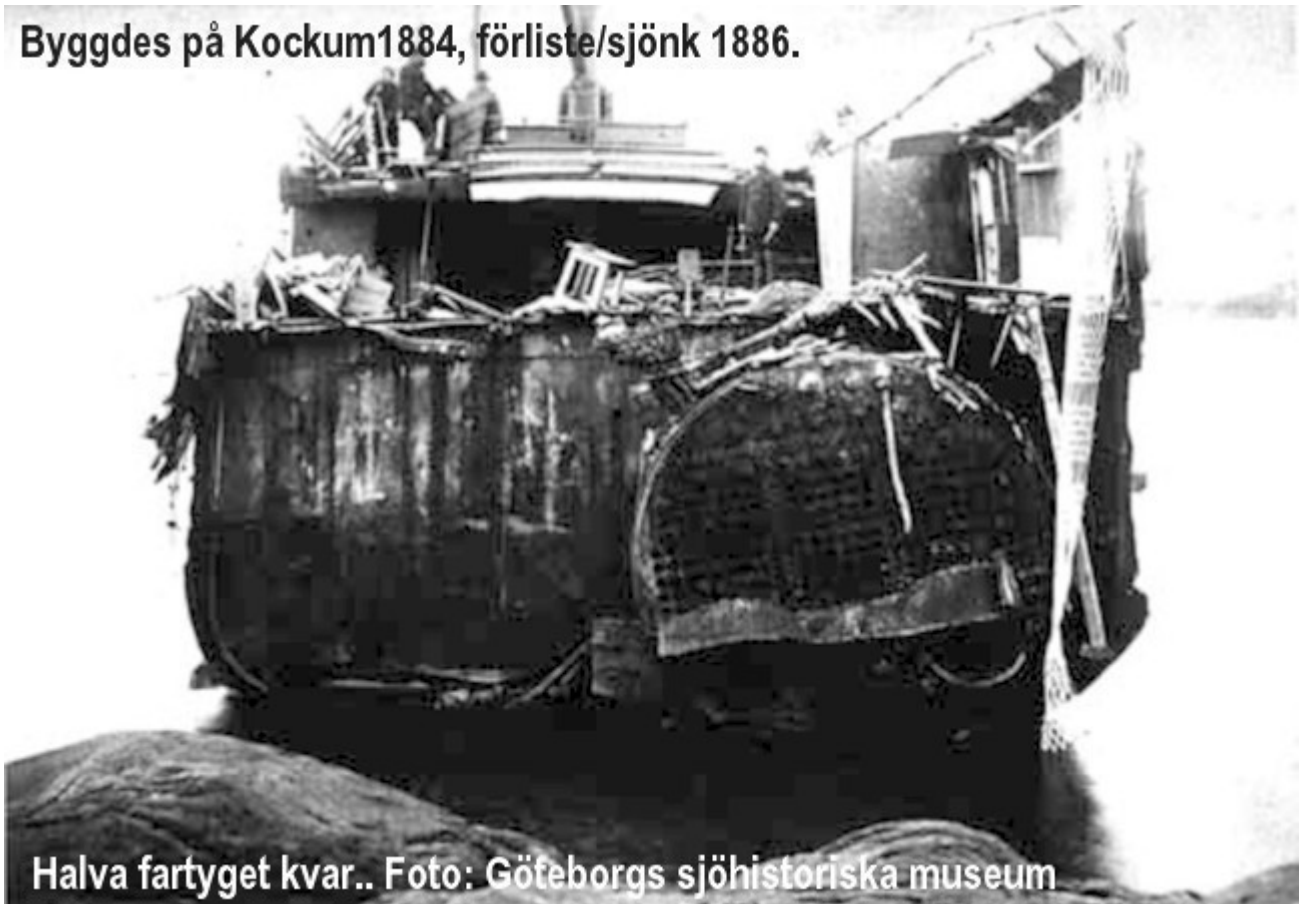
Halva fartyget kvar..

Byggdes på Kockum 1884, förliste/sjönk 1886.