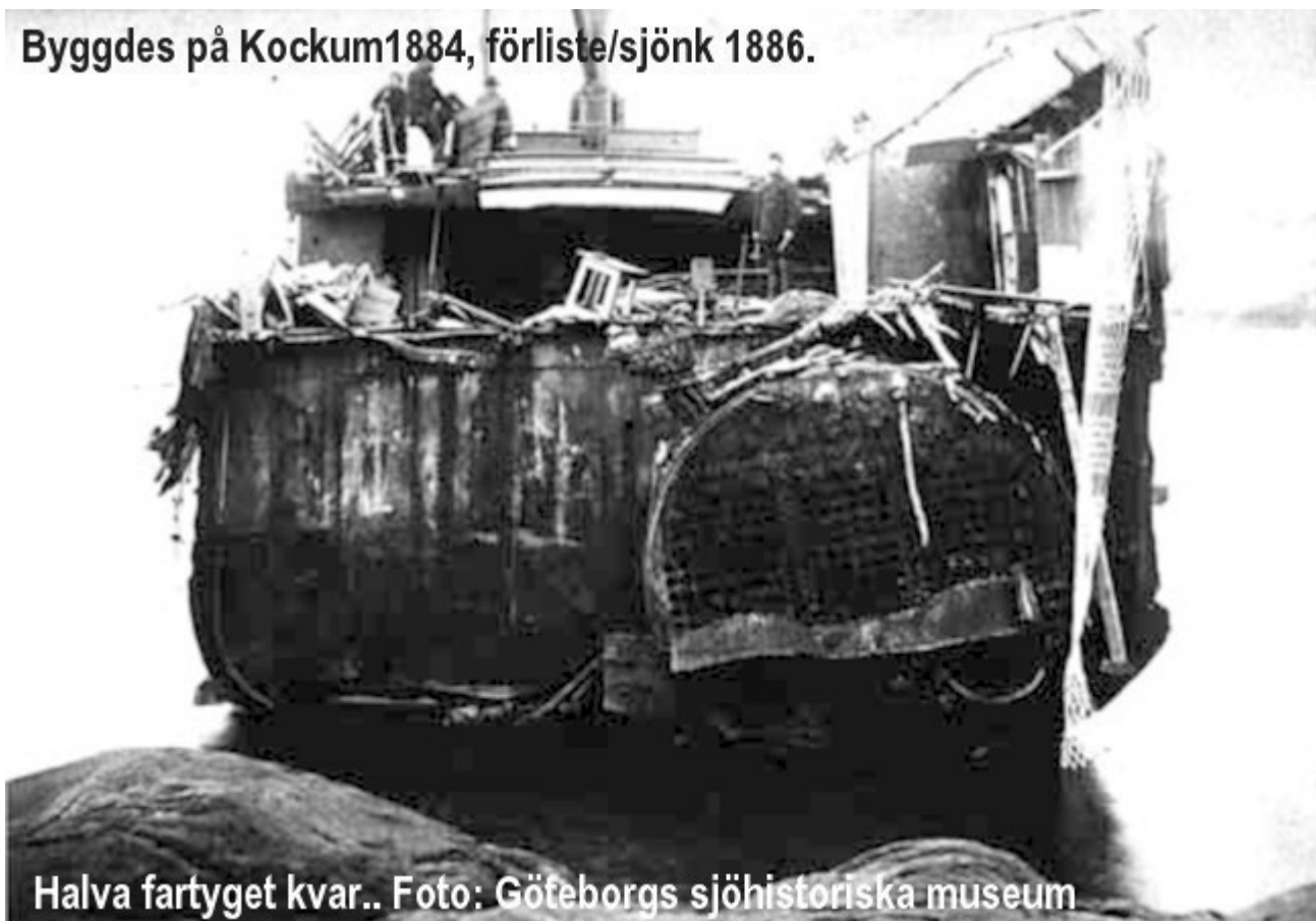
Halva fartyget kvar..

Byggdes på Kockum 1884, förliste/sjönk 1886.