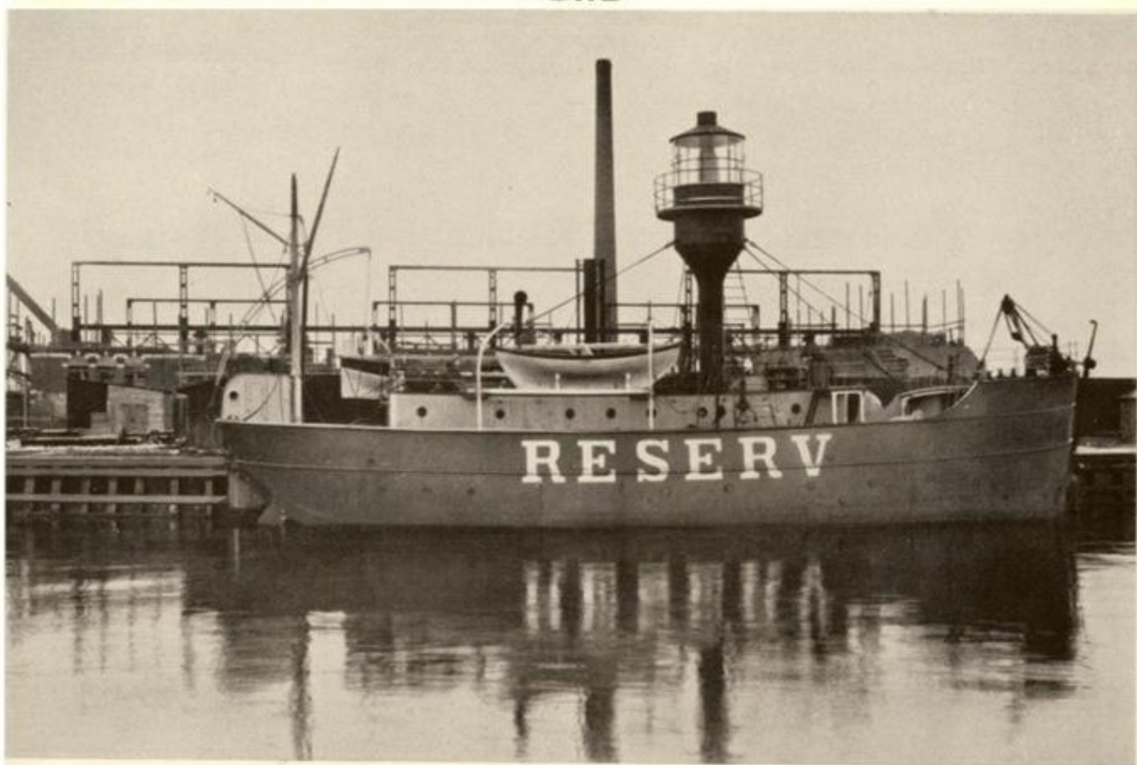
The Light Ship Reserv

Kommentar: Fart. b.nr 81, Fyrskippet RESERV, 115 depl. Levererat 1899 till Kungliga Lotsstyrelsen, Stockholm/ BoN