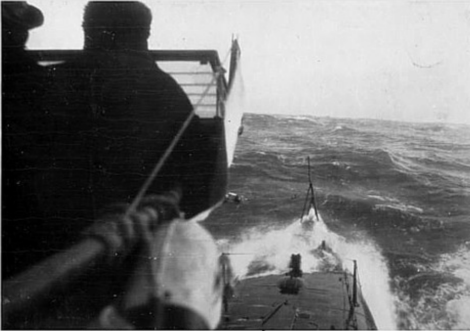
Nordsjön mars 1922. Första expeditionen för ubåten Valrossen till främmande vatten

Nordsjön mars 1922. Första expeditionen för ubåten Valrossen till främmande vatten.