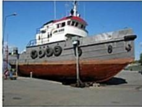
Karl Alfred

För fler bilder se: http://www.tugboatlars.se/Pitsund.htm