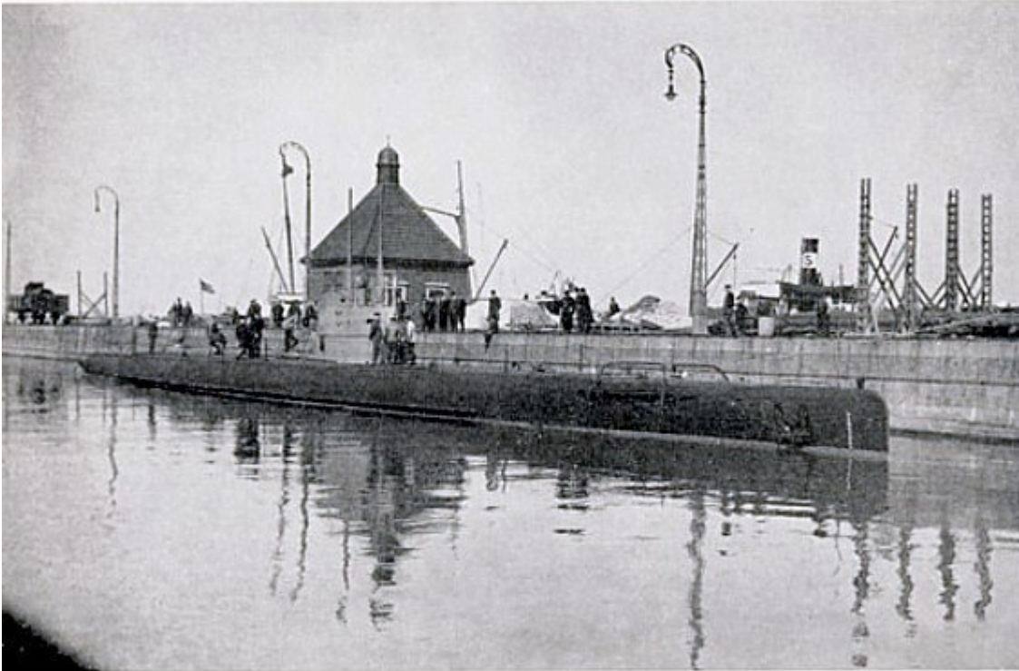
Hajen II vid kaj i Malmö, klar för leverans

Hajen II vid kaj i Malmö, klar för leverans.