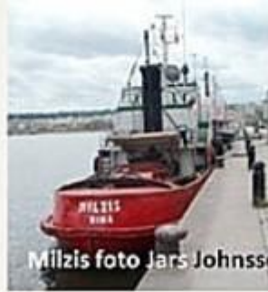
Milzis foto Jars Johnsson