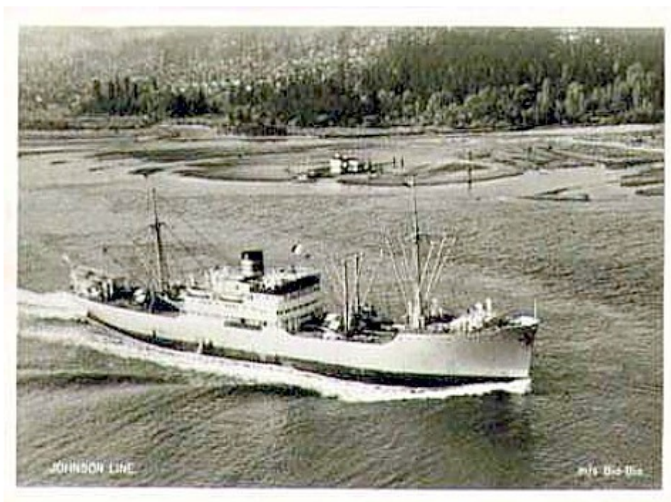
Johnson Line. M/S Bio-Bio