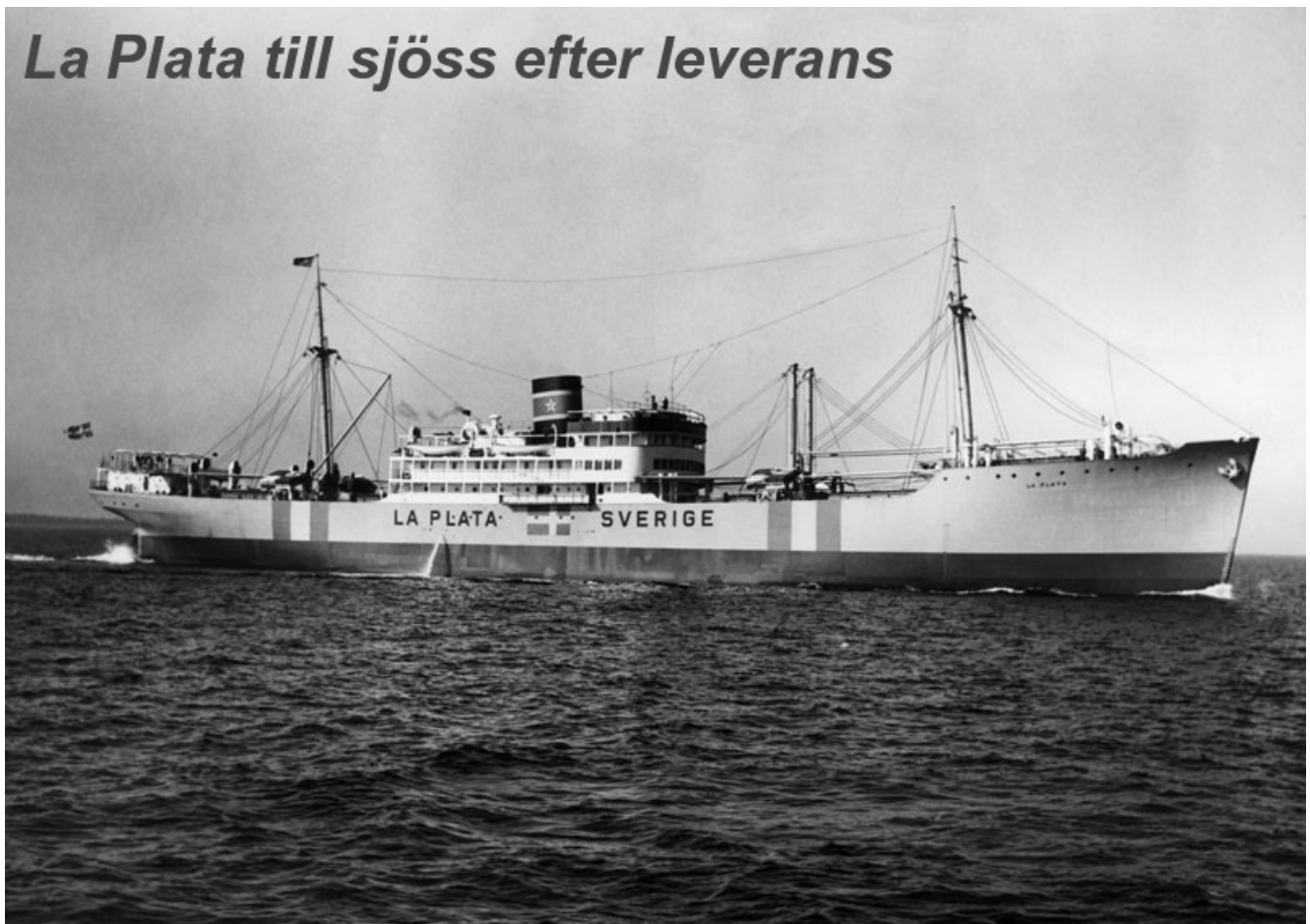
La Plata till sjöss efter leverans.