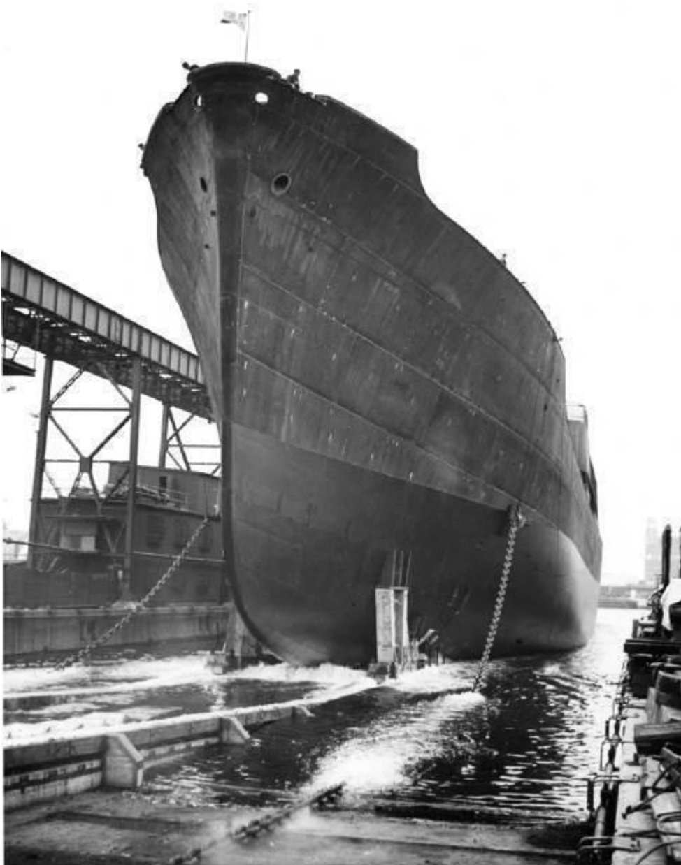
La Plata sjösättning 1942.