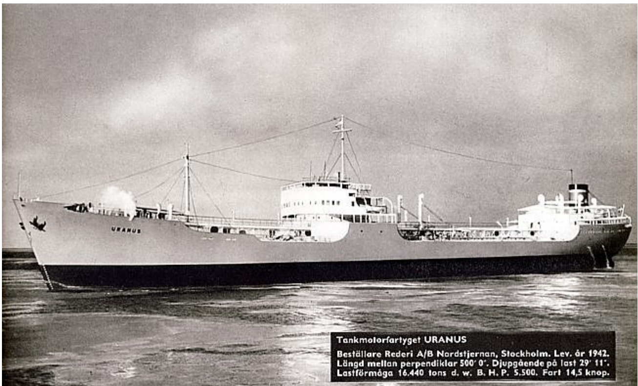
Tankmotorfartyget URANUS Beställare Rederi A/B Nordstjernen, Stockholm. Lev. år 1942. Längd mellan pendiklar 500' 0". Djupgående på last 29' 11". Lastförmåga 16.440 tons d. w. B. H. P. 5.500. Fart 14,5 knop.