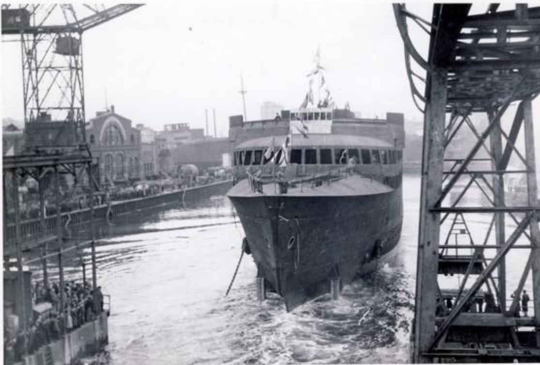
B.nr 219 Tåg färjan Malmöhus Sjösättning från bädd 2 den 10.10 1943