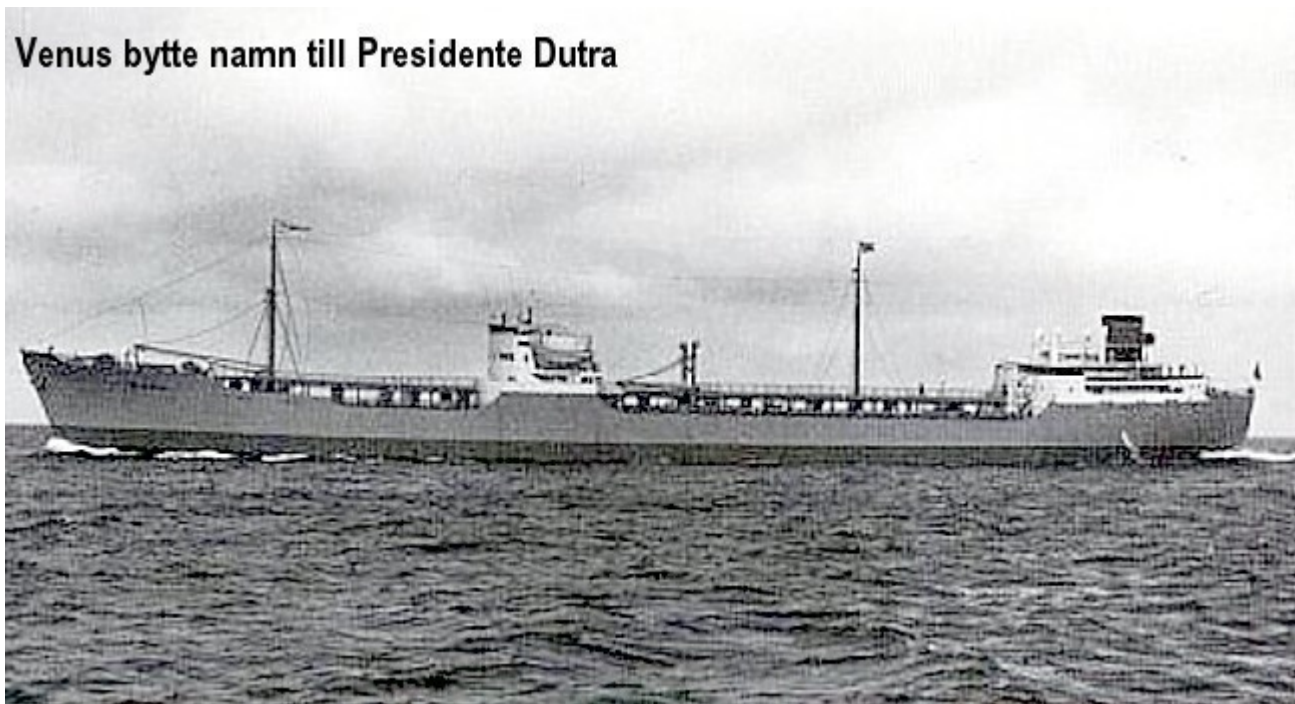
Venus bytte namn till Presidente Dutra

Venus bytte namn till Presidente Dutra .