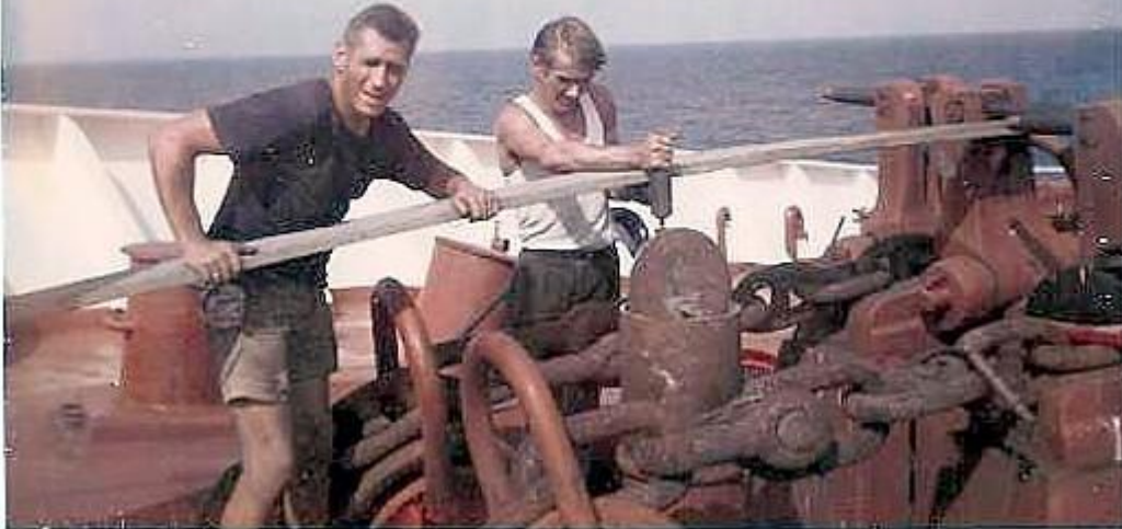
Ombord på b.nr 440 Lidvard (II)