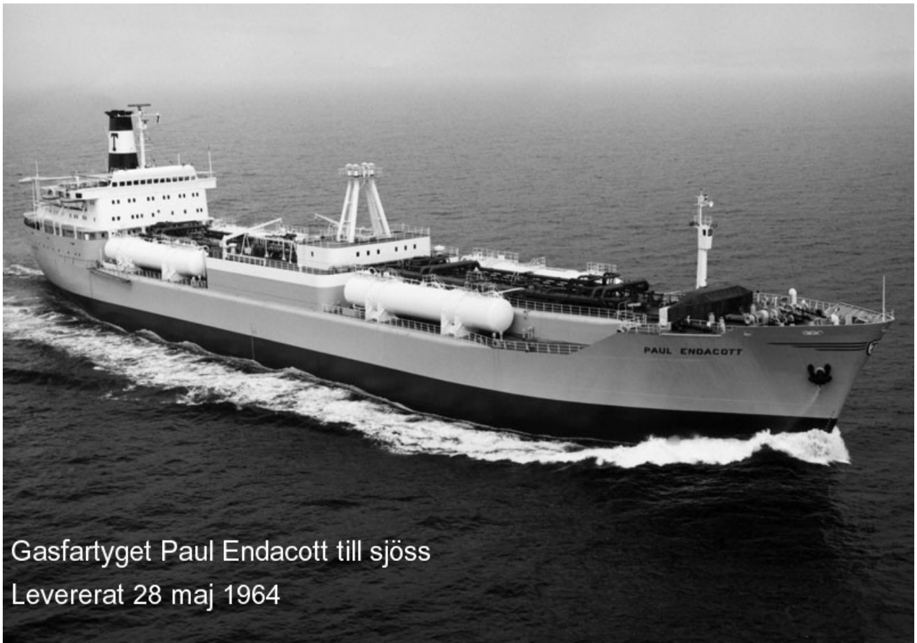
Gasfartyget Paul Endacott till sjöss Levererat 28 maj 1964