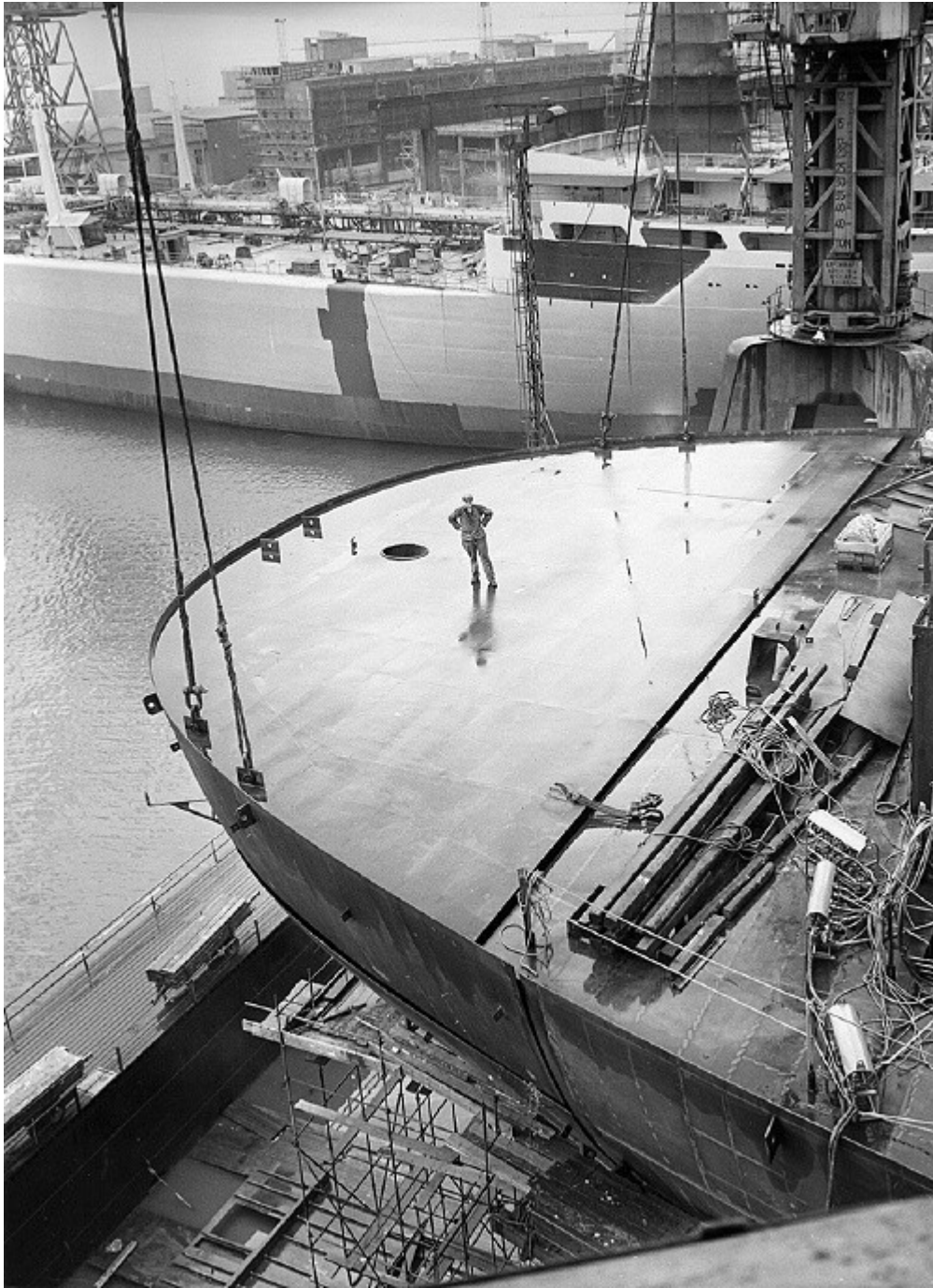
Bnr 472 Turbintankern Esso Yorkshire får här sin aktersektion satt på plats.