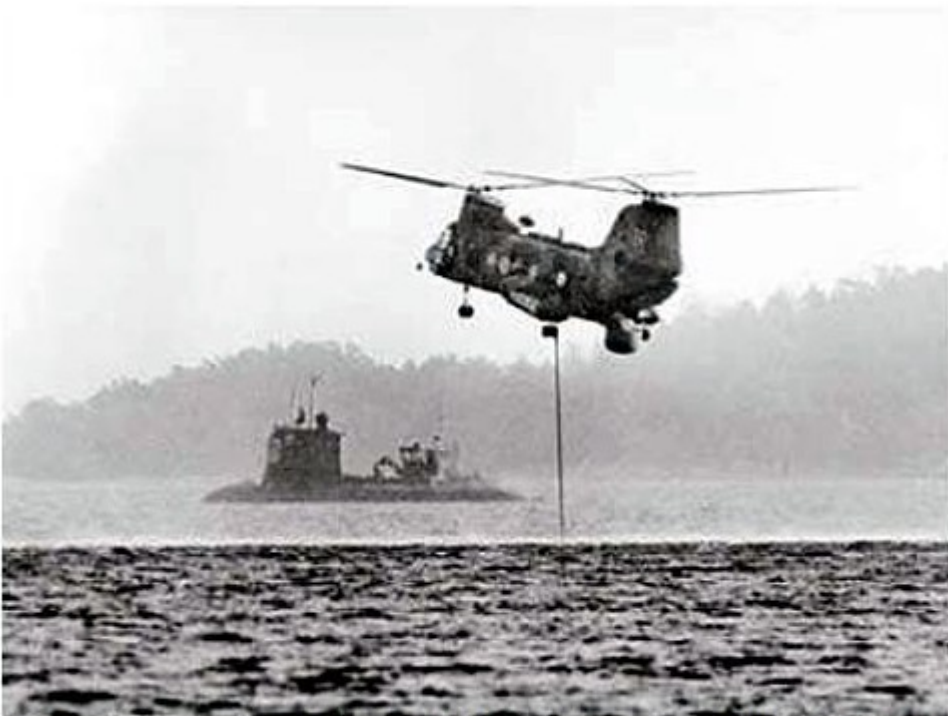
Ubåten Sjöhunden spärrar utloppet till Hårsfjärden oktober 1982. Helikopter med aktiv sonar i förgrunden.