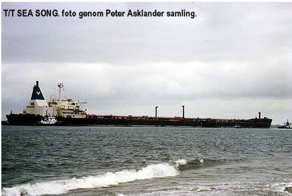
T/T Sea Song.