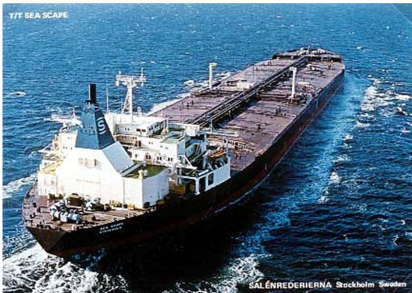
T/T Sea Scape. Salénrederierna Stockholm Sweden