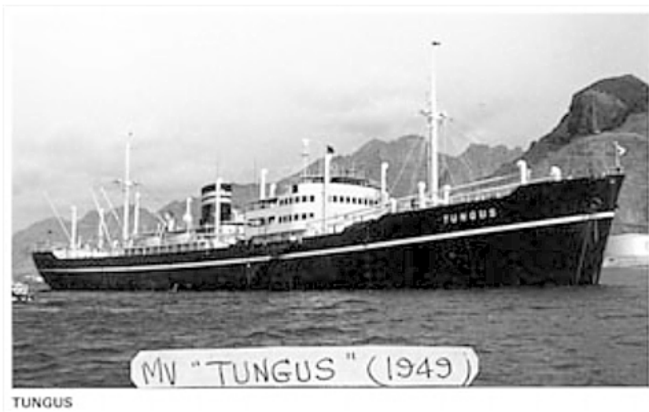
MV Tungus (1949).