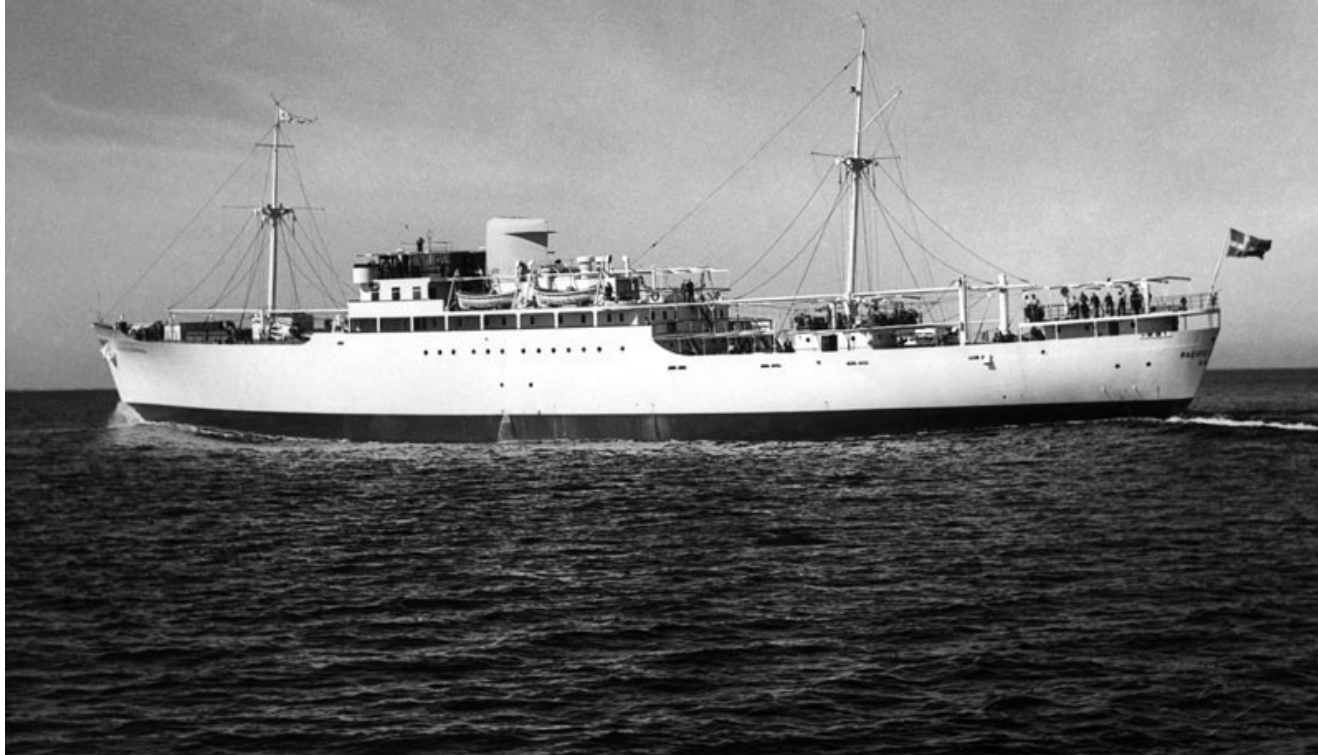
Pacific Express till sjöss efter leverans.

Pacific Express till sjöss efter leverans