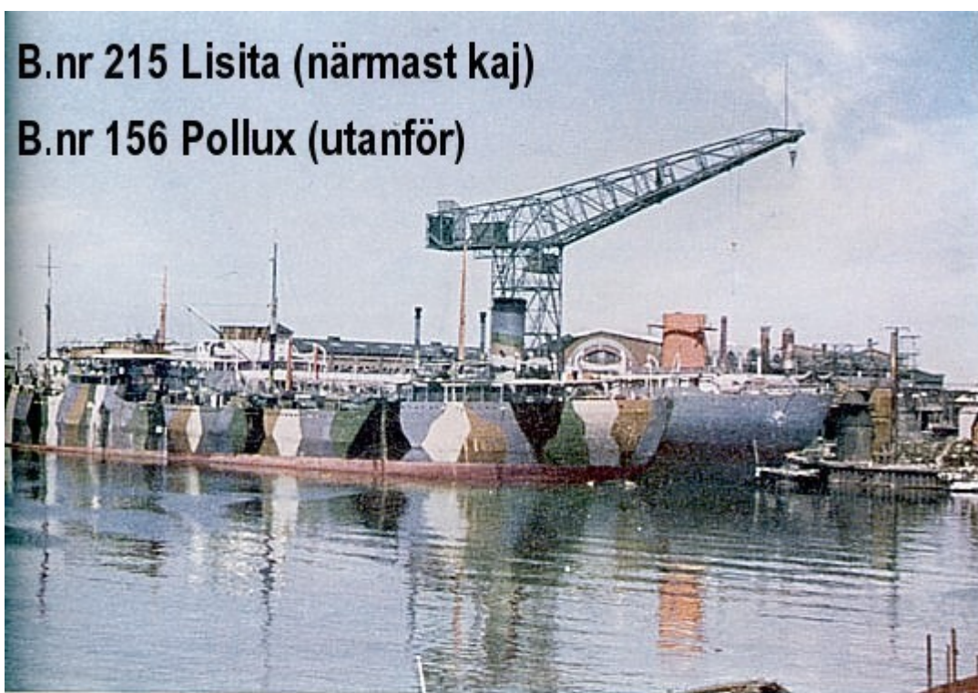
Varvsbassängen och utrustningskajen 1 juli 1940.

Närmast utrustningskajen 13.000 d. w. tons tankfartyget Lisita, byggn. nr. 215, under utrustning. Utanför detta tankfartyget Pollux av Trelleborg, levererad av verkstaden 1928 och nu undergående 12-års klassning.