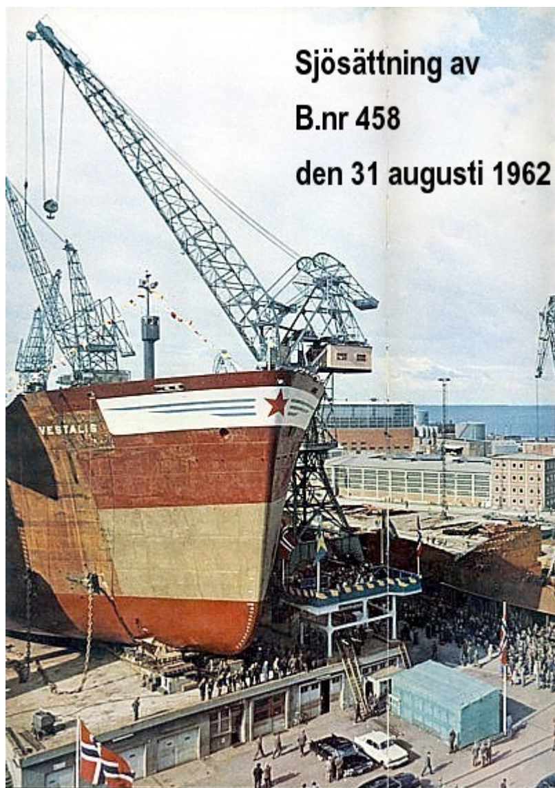
Sjösättning av B.nr 458 den 31 augusti 1962.