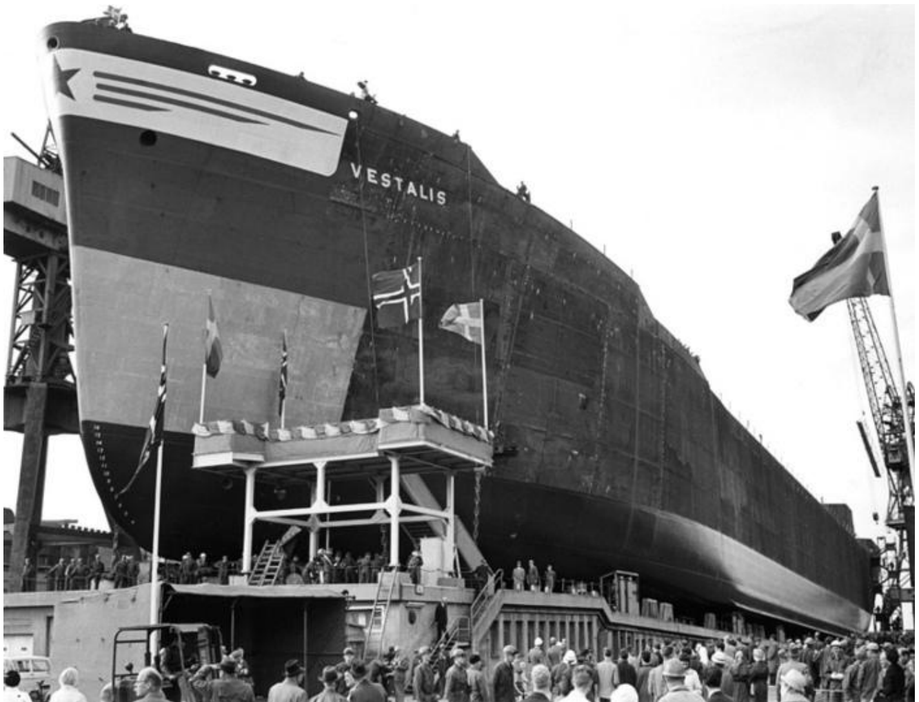
Motortankern Vestalis, bnr 458, levererad 1963.