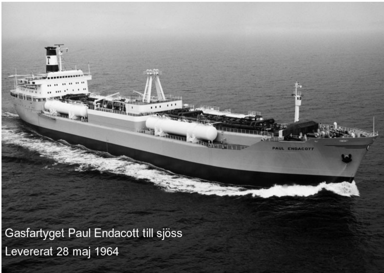
Gasfartyget Paul Endacott till sjöss Levererat 28 maj 1964

Gasfartyget Paul Endacott till sjöss. Levererat 28 maj 1964.