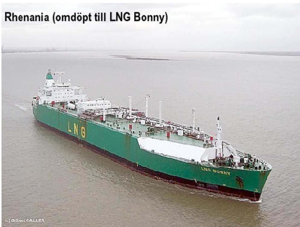
Rhenania (omdöpt till LNG Bonny)