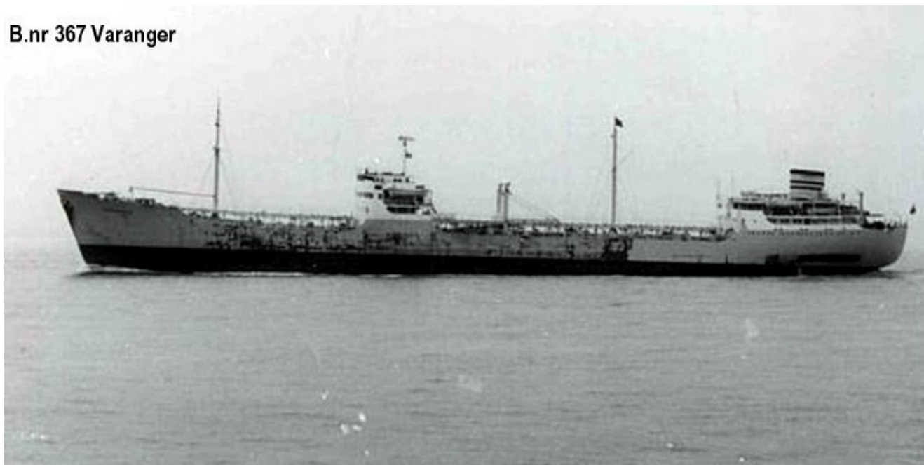
B.nr 367 Varanger