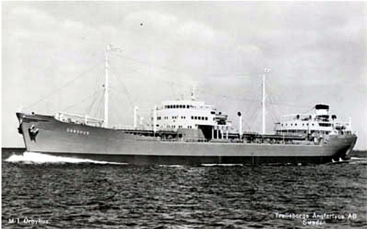
M/T Örbyhus. Trelleborgs Ångfartygs AB, Sweden.