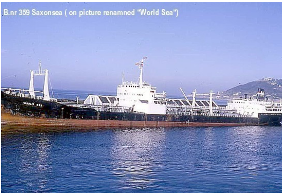
B.nr 359 Saxonsea (on Picture renamed World Sea ).