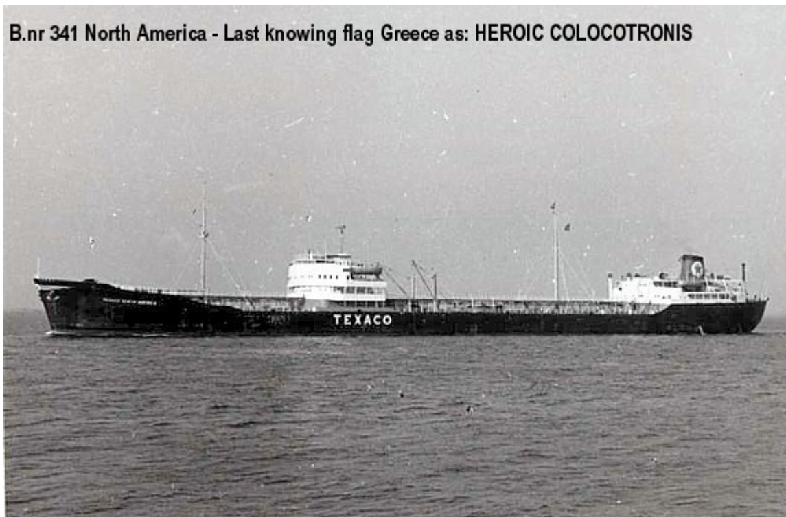
B.nr 341 North America - Last knowing flag Greece as: HEROIC COLOCOTRONIS

B.nr 341 North America – Last known flag Greece as Heroic Colocotronis.