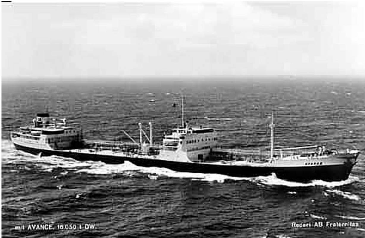
M/T Avance 16.050 t DW. Rederi AB Fraternitas.