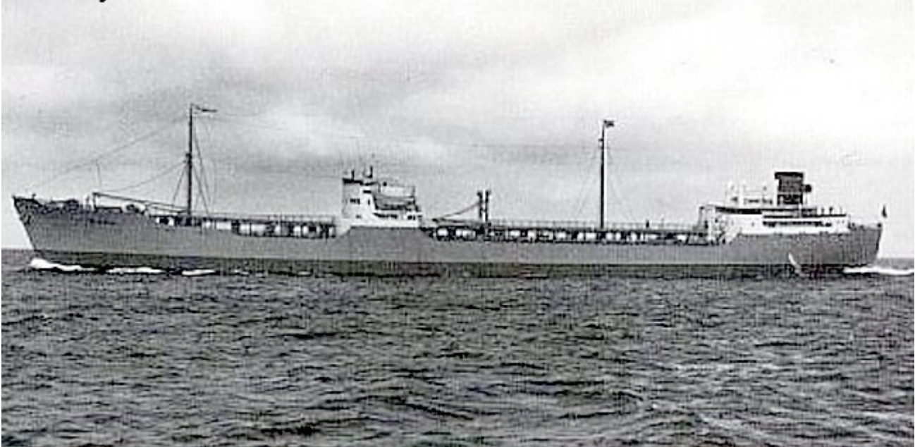
Venus bytte namn till Presidente Dutra

Venus bytte namn till Presidente Dutra .