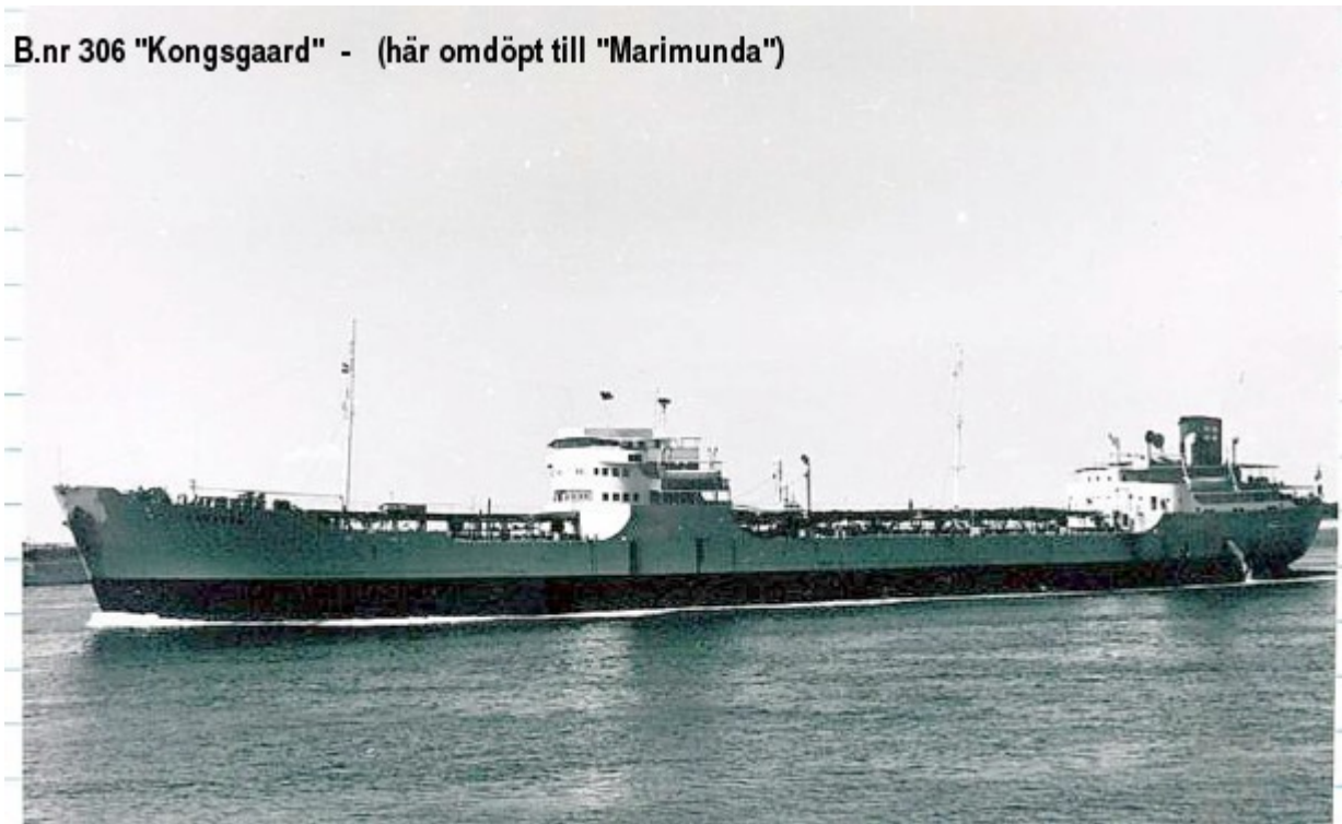
B.nr 306 "Kongsgaard" - (här omdöpt till "Marimunda")

B.nr 306 Kongsgaard (här omdöpt till Marimunda ).