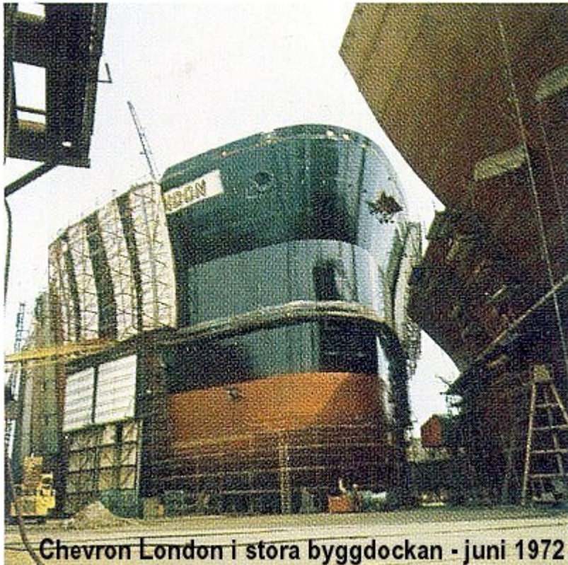
Chevron London i stora byggdockan - juni 1972

Chevron London i stora byggdockan – juni 1972