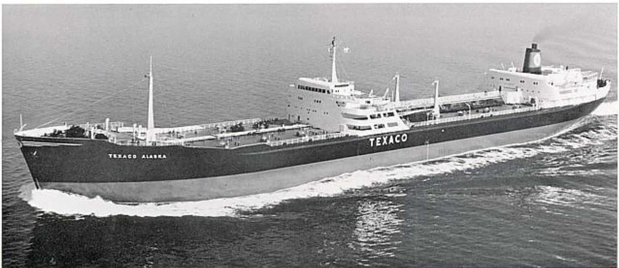
S.T. TEXACO ALASKA, turbine tank ship 41,050 tons d.w., 17¼ knots.