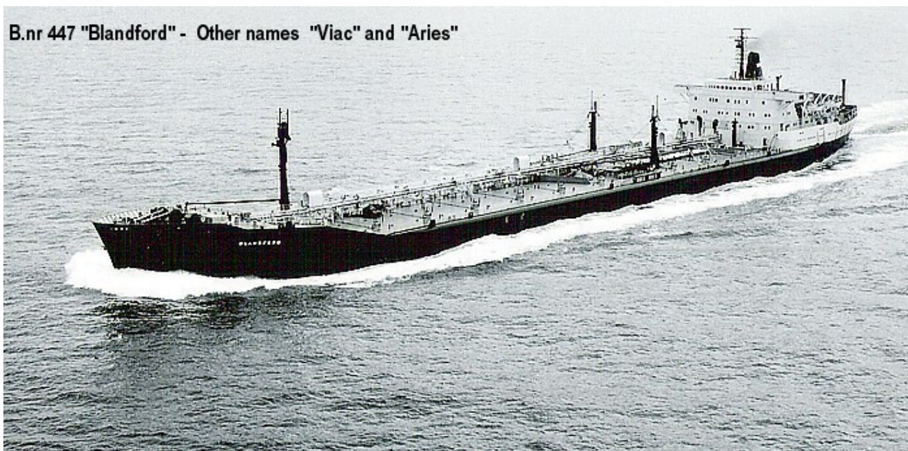
B.nr 447 "Blandford" - Other names "Viac" and "Aries"

B.nr 447 Blandford . Other names Viac and Aries .