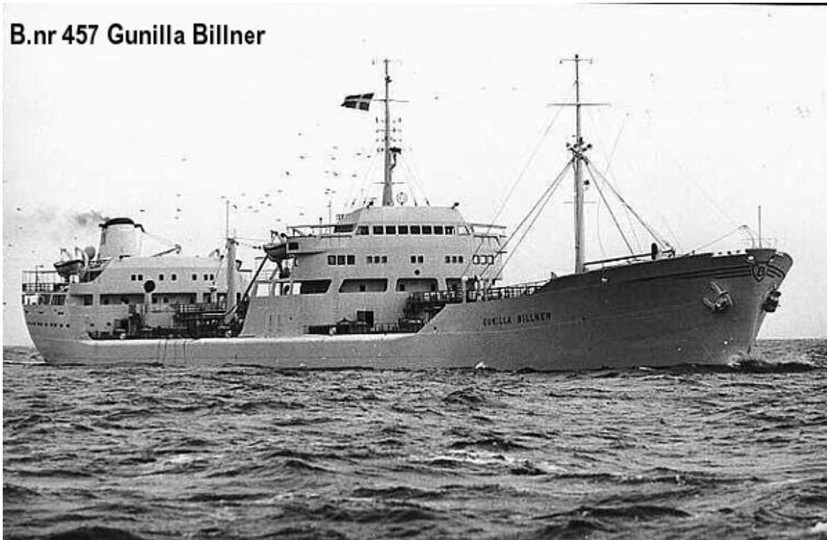
B.nr 457 Gunilla Billner