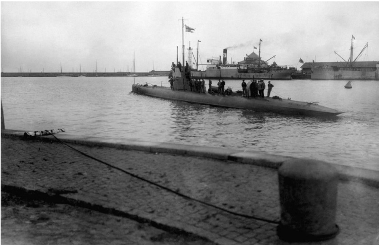
UB Svärdfisken (b:nr. 115) - leveransprovttur 1914.

UB Svärdfisken (b:nr. 115) – leveransprovttur 1914.