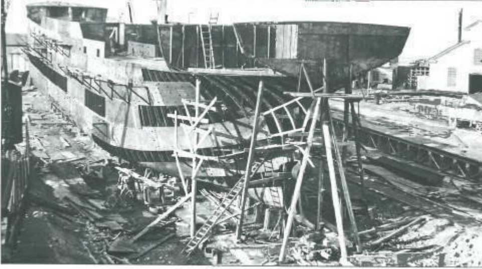
Limhamns Skeppsvarv den 17 oktober 1918. S/S Fylgia, varvets tredje fartyg under byggnad.