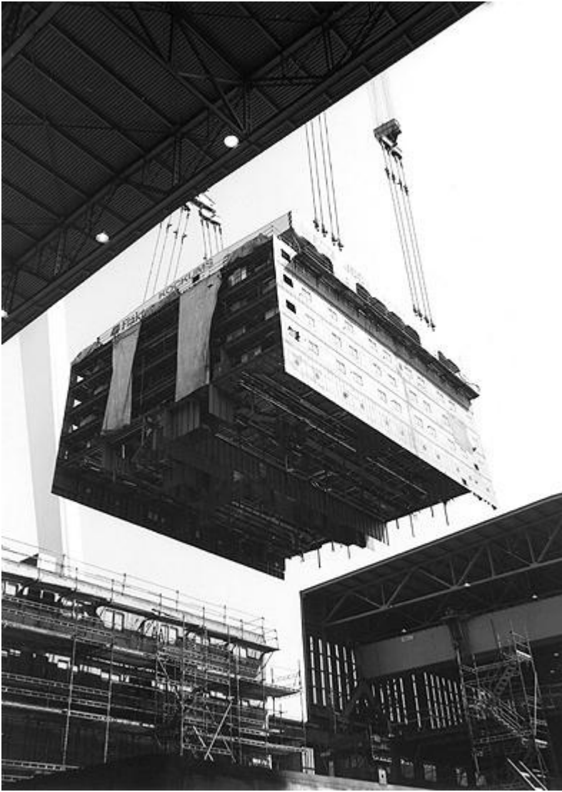
Hotellsektion: En hotellsektion på över 1000 ton med 175 hytter lyfts på plats till ett av kryssningsfartygen Celebration eller Jubilee.