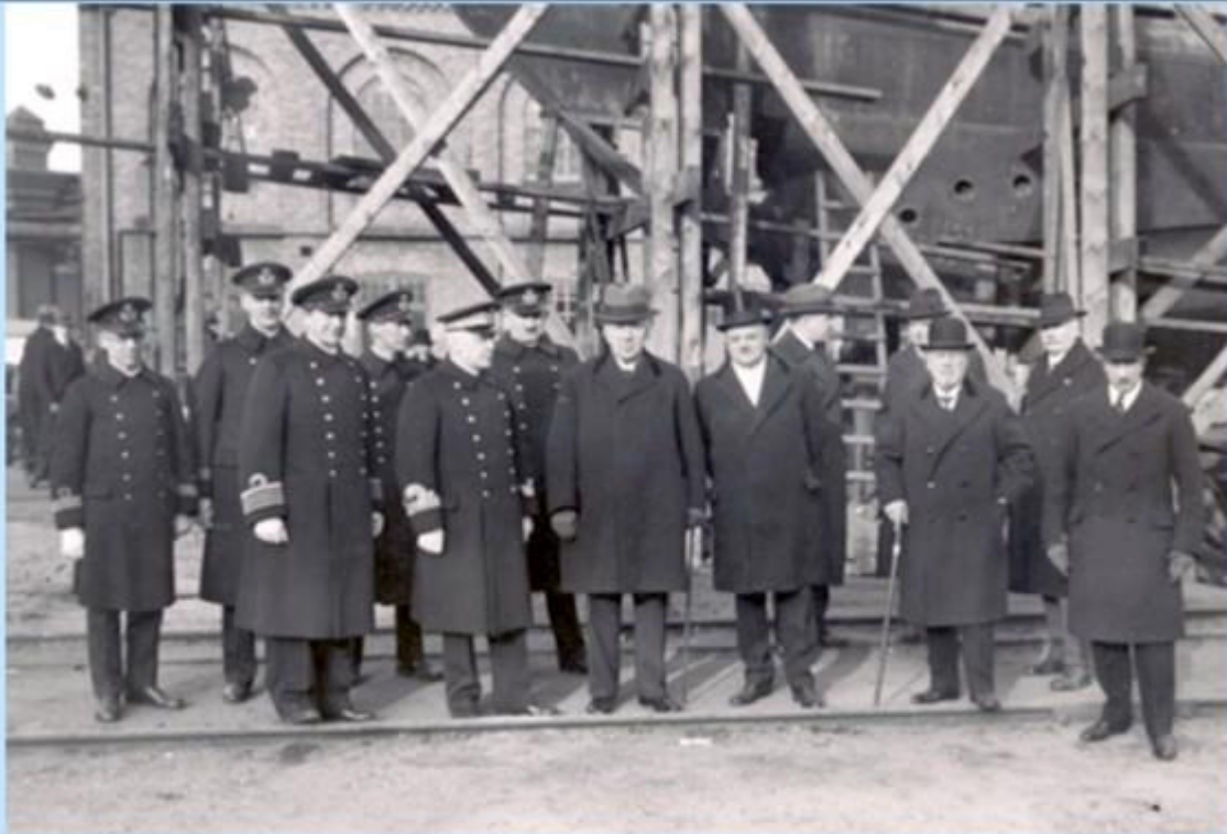
9 februari 1935 – vid sjösättningen av ubåten Nordkaparen (I) – b.nr 177 5:e f.v med största sannolikhet chefen för marinen, Charles Le Champs 3:e f.h Kockums VD Georg Ahlroth – allmänt kallad "Käppen". Nordkaparen levererades 16 oktober 1936.

9 februari 1935 – vid sjösättningen av ubåten Nordkaparen (I) – b.nr 177.