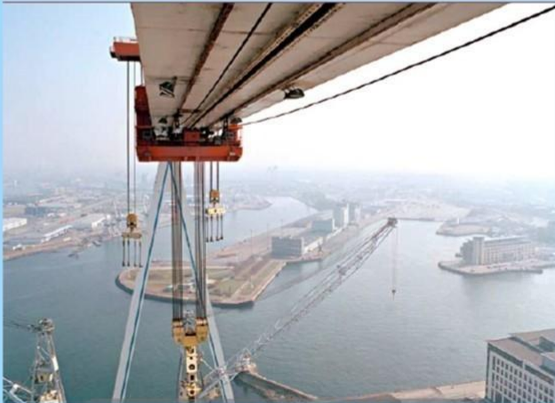
Troligen slutet 1990 -talet

En fin bild som visar kranens tre lyfthöror. I mitten den stora s.k "Mitthönan" - 800 ton max. På var sida om denna ses "Porthönan " och "Hallhönan" - båda vardera 400 ton max. Kranen dock max 1500 totalt inklusive riggning (Ok med mera).