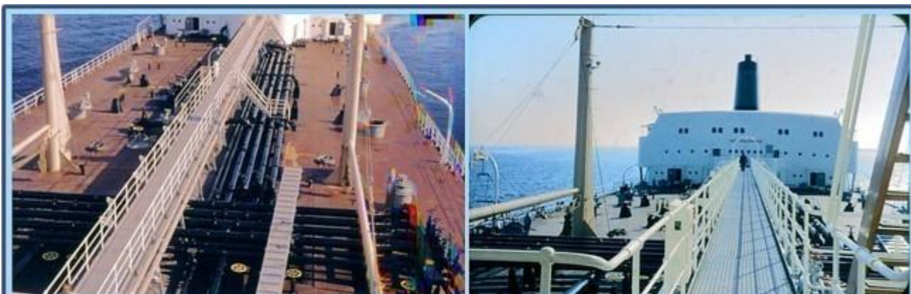
Sensommaren 1960 - Provtur i Öresund med b.nr 448, T.T Texaco Alaska