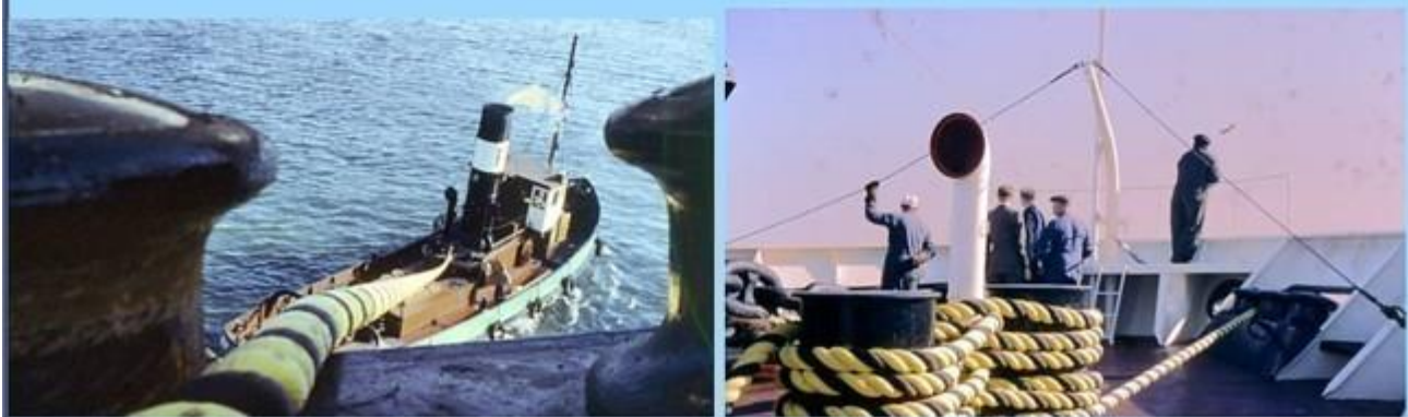
Sensommaren 1960 – Provtur i Öresund med b.nr 448, T. T Texaco Alaska.