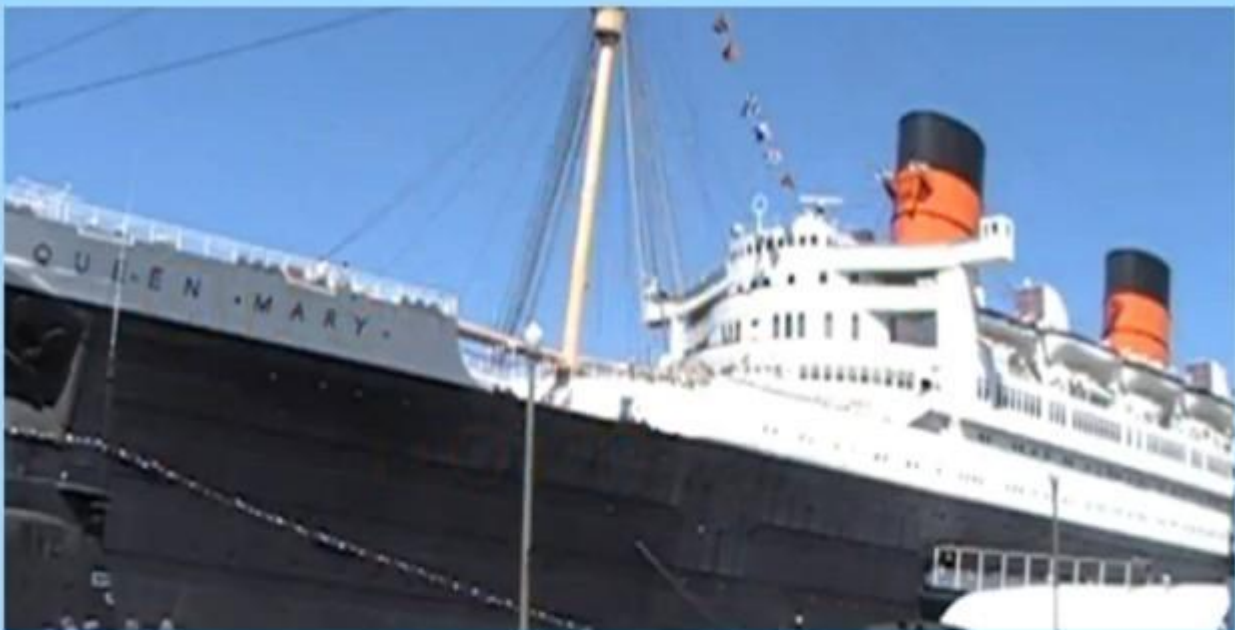
Bild någon gång 1936 - 1967