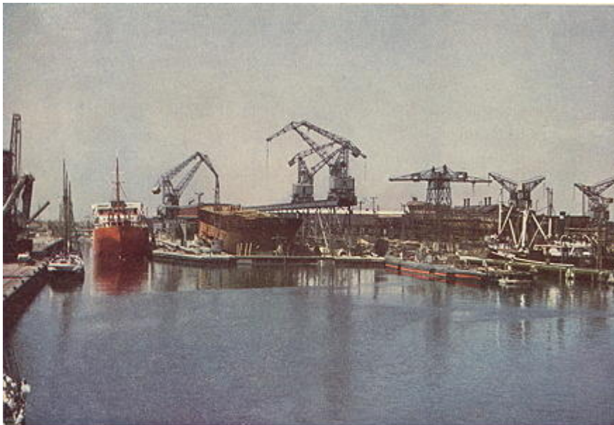
Varuskanalen och varvsbassängen 1 juli 1940.

Vid kanalkajen m/s Pacific Express, byggn. nr. 225, under utrustning. På bädd V 16.250 d. w. tons tankfartyg, byggn. nr. 226. På bädd III 16.000 d. w. tons tankfartyg, byggn. nr. 216. Vid södra piren U-båten Svärdfisken under utrustning.