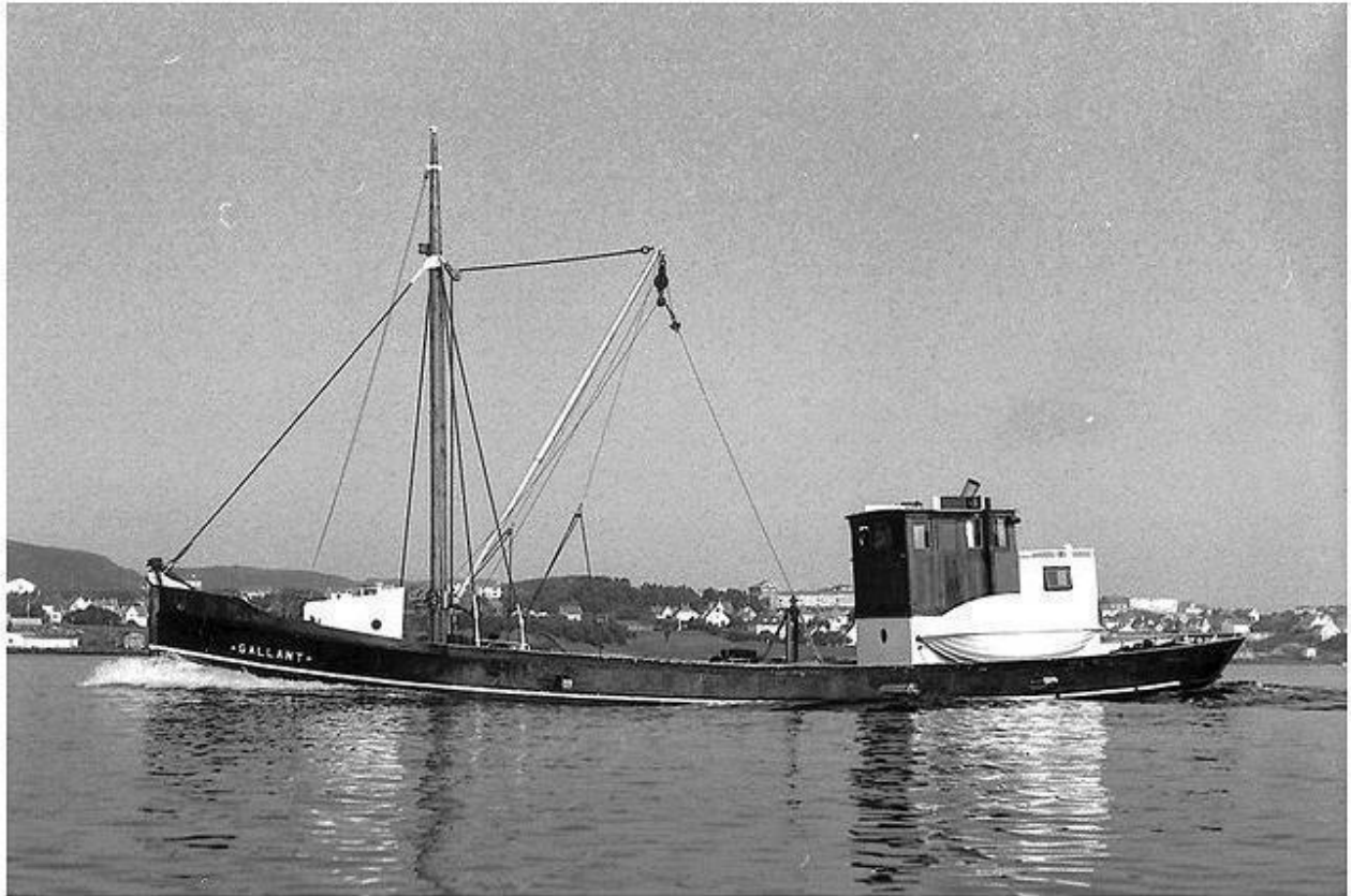
Gallant i sin beste vuinke

Slepebten TFTE 1 fra 1883 ble i 1956 kjøpt til Ølensvåg for å bygges om til fraktebåt. Ut av dette oppstod ØKLANDSNES, bedre kjent som GALLANT. Den var i sving til rundt 1980 og ble i 1983 solgt til Tyskland for ombygging til lystbåt.