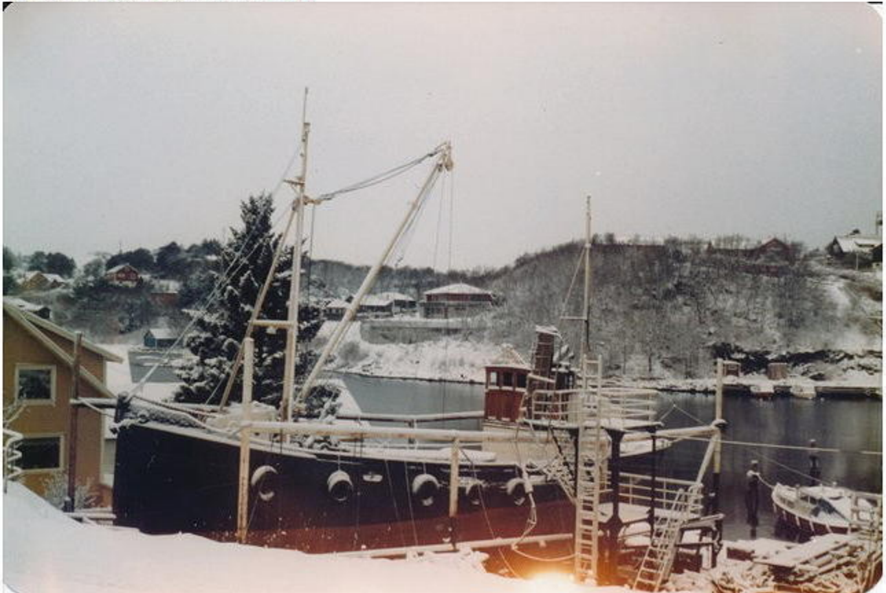
På slipp i KOpervik 1981