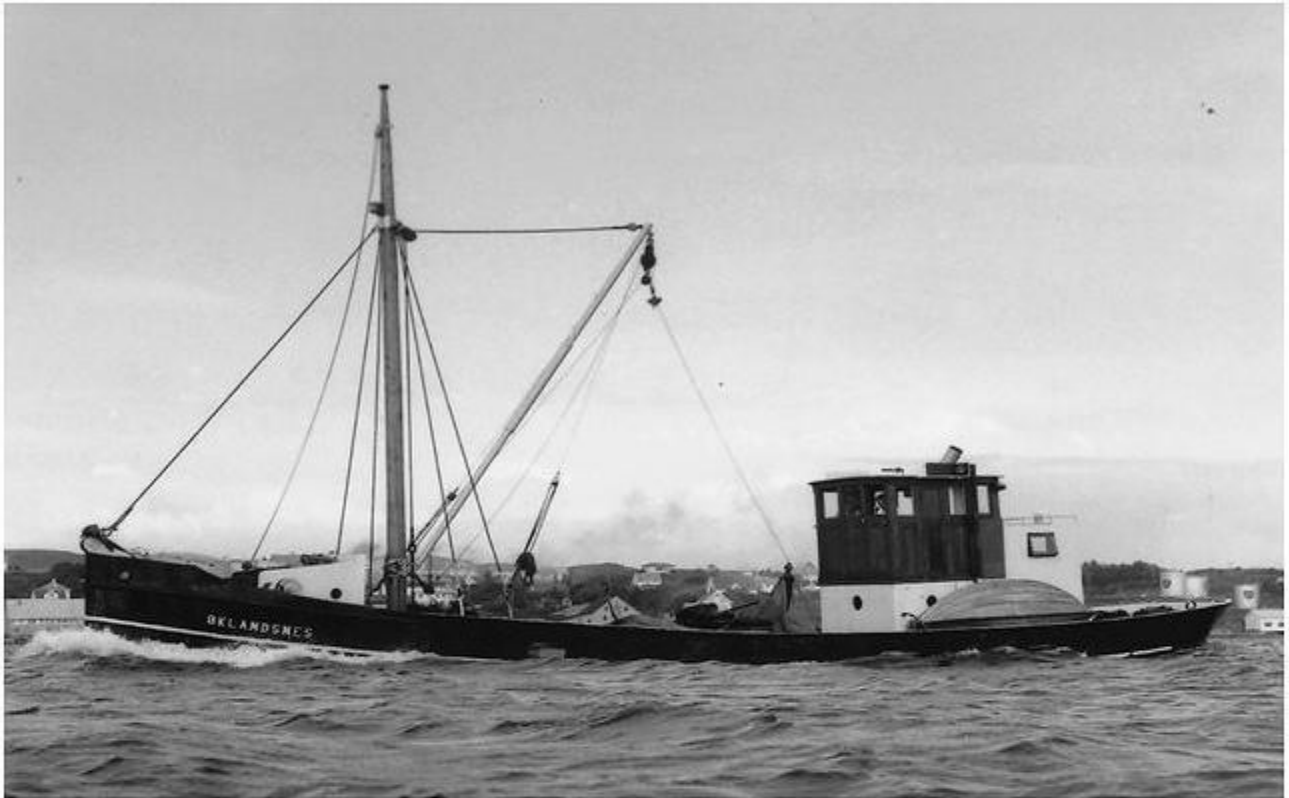
Som Øklandsnes, NSS-Jenssensamlingen