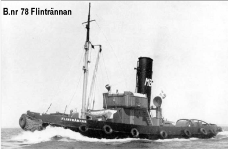
B.nr 78 Flintrännan