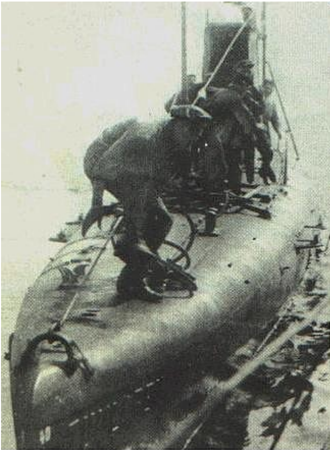
Ubåten Tumlaren byggd på Kockums i Malmö 1914. Deplacement 252 ton.