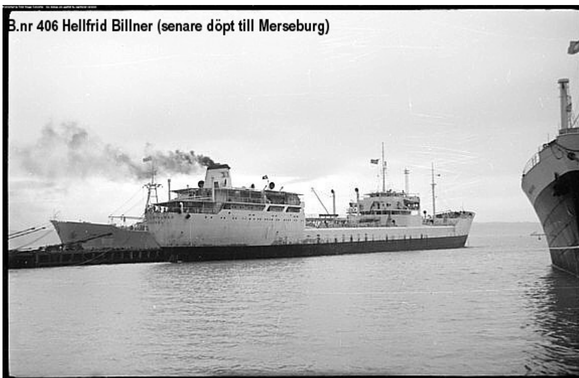
B.nr 406 Hellfrid Billner (senare döpt till Merseburg )